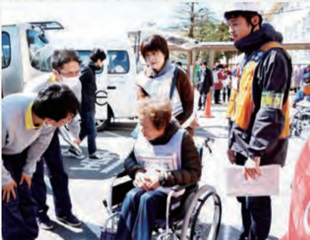
訓練には学校、地域、福祉施設職員など総勢313人が参加しました