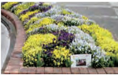
▲昨年度入賞した習志野 台団地花愛好会の花壇

地域での緑化や花壇づくりの取り組みをさらに広げていくため、今年も「まちかどフェア」の一環として、同コンテストの参加者を募集します。 〈募集期間〉5月8日(金)まで 〈対象〉個人もしくは団体（町会、自治会、