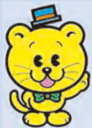
千葉県明るい選挙 シンボルキャラクター「せんぎょ君」