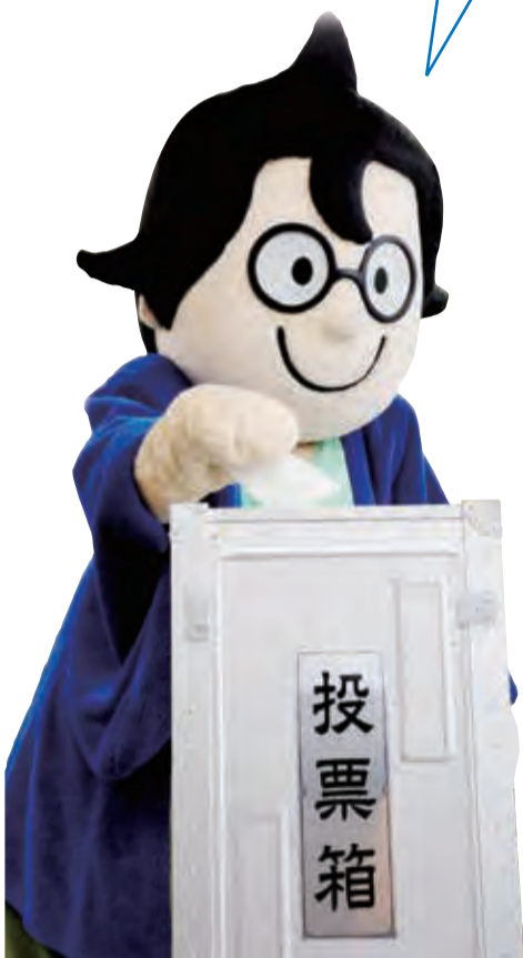
ふなばし産品ブランドPRキャラクター 「目利き番頭 船えもん」