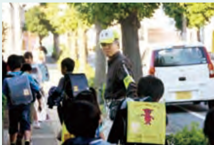
▲子どもたちの通学を温かく見守ります

人が所有する 〈助成額〉ブロック塀等の長さ1メートルあたり1万円まで※1件あたり10万円が上限 〈申込み〉事前相談書に必要書類を添えて、10月30日(金)までに建築指導課へ ■事前相談書は同課で配布するほか、市ホームページからも取り出せます。