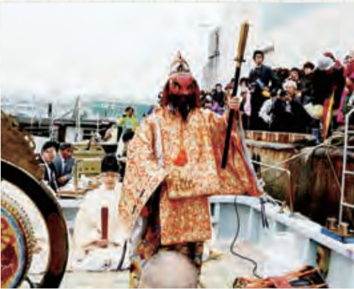
▲市指定無形民俗文化財の船橋大神宮の神楽

4月3日、春の漁がはじまる節目に市漁業協同組合が主催する水神祭が行われ、地元の町会等が参加しました。これは江戸時代から続く伝統行事です。接岸された船上で神事が執り行われ、神楽が奉納されました。続いて、関係者によるもちまきの後、漁船は沖に出て、米や麦などの五穀を海にまき、海上の安全と豊漁を祈願しました。