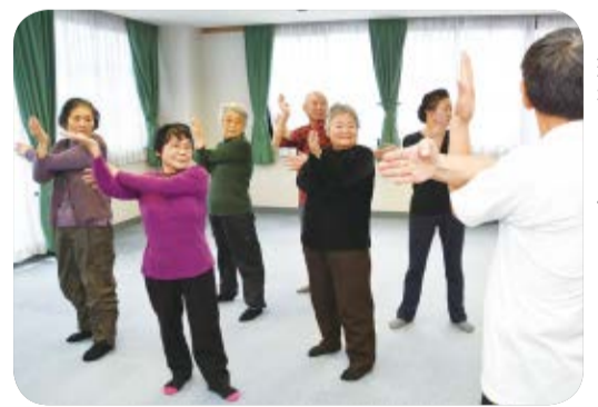
▲いきいきと楽しく健康づくり(南老人福祉センター)