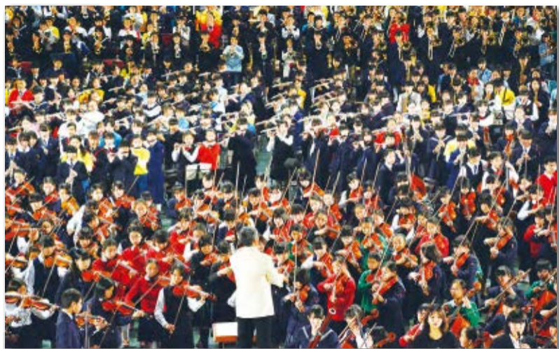
▲小・中学生1400人によるオープニングの「ボレロ」は圧巻!

各分野で活躍するさまざまな人・団体と、良質な産品、歴史や文化、イベントなど、活気あふれる船橋の魅力をご紹介します