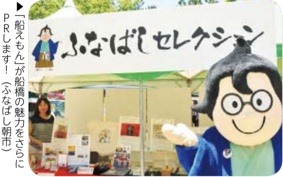
▶「船えもん」が船橋の魅力をさらにPRします!(ふなばし朝市)