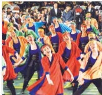
▲市立船橋高校吹奏楽部が元気いっぱいのよさこいで会場を盛り上げました