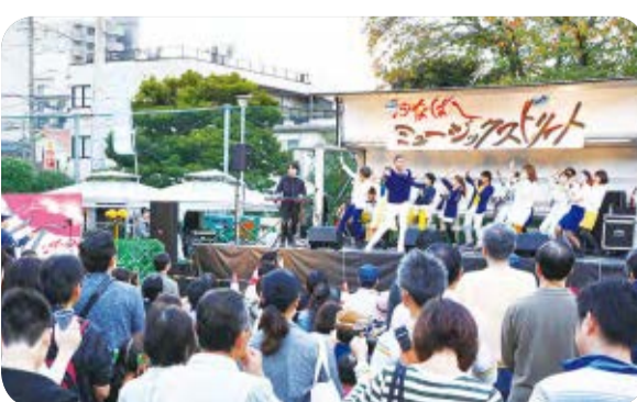
▶「音楽のまち・ふなばし」の新たなビッグイベント「ふなばしミュージックストリート」

え、まちづくりを意識してもらうため、市内中学生の代表と市長が船橋の将来を語り合う「子ども未来会議室」を26年度に引き続き開催します。子どもたちからの提案は、27年度の予算編成に活かされています。