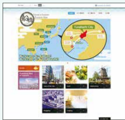
▲船橋市を海外にアピールするための外国人向けサイト

トップページの文字やアイコンを整理し必要な情報を見つけやすくしたほか、高齢者向け情報を集めたページや、船橋の魅力の世界に発信する外国人向けのページを新設しました。身近になった市ホームページをぜひご利用ください。