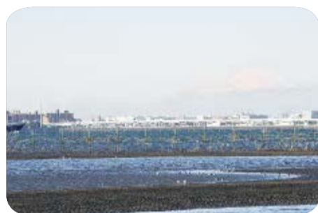
▲冬場の好天に恵まれた日には、美しい富士山が望めます(ふなばし三番瀬海浜公園)

北部清掃工場は、余熱利用施設も含めて設計から建設、運営までを一括して民間事業者が行う方式で建て替え工事