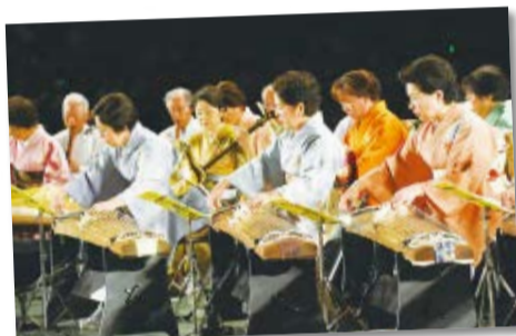
▲箏や尺八による童謡メドレーなどを演奏

2月8日に船橋アリーナで行われた「音楽のまち・ふなばし千人の音楽祭」。総勢2300人を超える出演者が管弦楽や吹奏楽、合唱などを披露し、会場は音楽で心がひとつになりました。