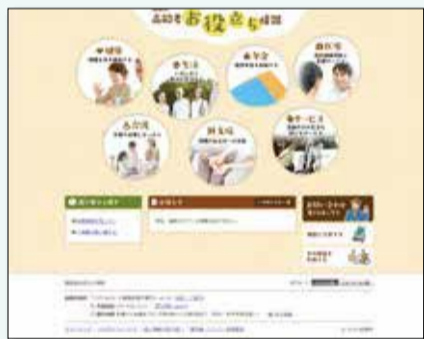
◀医療や介護サービスなど、生活に必要な情報にすぐアクセスできる「高齢者お役立ち情報」