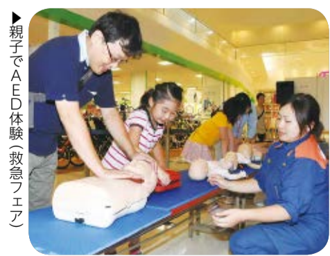
親子でAED体験(救急フェス)