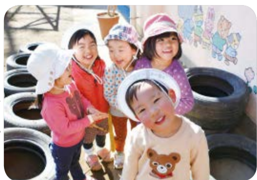
子どもたちの笑顔がいつだって(本町保育園)

全市立小・中・高等学校に週1回配置されているスクールカウンセラーの相談日数を、小学校全体で年間30日増やし、支援体制の充実を図ります。