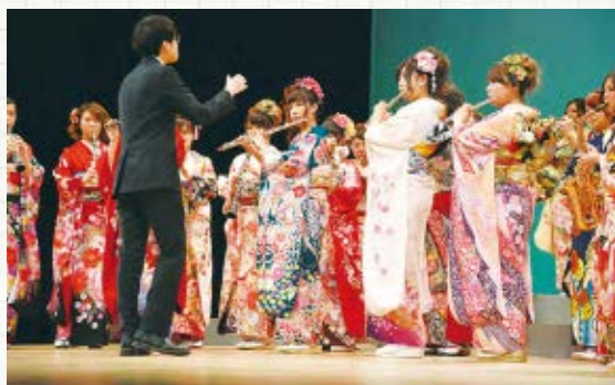
▲華やかな晴れ着で演奏を披露

1月12日に成人式が市民文化ホールで行われました。今年度、市内で新成人になったのは5799人(昨年度から約400人増)。式典で松戸徹市長は「この節目に目標を持ち、国外も視野に入れるなど、いろいろなことに挑戦してください」と祝辞を述べました。