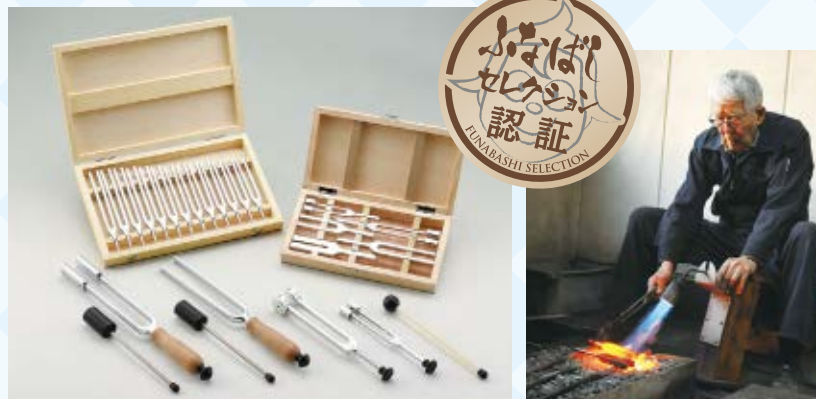
▲音楽用、医療用、マッサージ用など幅広い種類があります