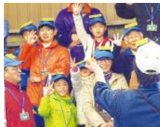
▲大盛りあがりの模擬せり

＜申込み＞2月6日(金)(必着)までに、ハガキに住所、電話番号、参加人数、参加者全員の名前(ふりがな)・年齢・性別を書いて、市場総務課(〒273-0001 市場1-8-1)へ