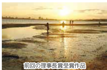
前回の理事長賞受賞作品