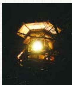
▲灯明台が、新成人の前途を明るく照らします