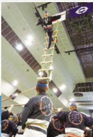
▲船橋市消防特別作業協力会による「はしご乗り」