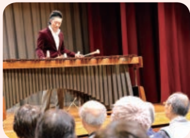
▲新高根公民館で昨年行われたクリスマスコンサート

「マリンバは演奏方法でさまざまな音色を出せるのが、特徴であり最大の魅力。コンサートでは、2時間でマリンバの世界をすべて見せます!」。若きマリンバ奏者の豊かな音色が、皆さんの心を温かく包み込みます。