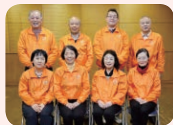
▲30代～80代までの「音楽好き」が集まり、ステージを盛り上げます

「ニーズに応えたいという気持ちで、活動のエネルギーになっていますね。メンバー全員で作り上げるコンサートを、ぜひ見に来てください」