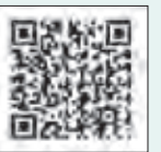
▲上記コードから申請画面にアクセスできます