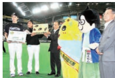
▲昨年は札幌ドームなどでもPR活動をしました

全国に誇る船橋の特産品「船橋のなし」が、11月14日に特許庁の地域名と商品名からなる“地域団体商標”に登録されました。JAいちかわでは「船橋のなし」の知名度を全国に広めようとさまざまな取り組みを行っており、その一環で出願し認められたものです。なお、市内から登録されたのは「船橋にんじん」に続き2件目となります。