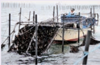
▲船橋三番瀬の海苔は伝統的な竹ひび式で養殖されています

あまり市場に出回らない、貴重な食材である船橋三番瀬の「生海苔」。海苔の収穫期は11月下旬から3月頃までと短いことから、食べることができるのはこの時期だけです。