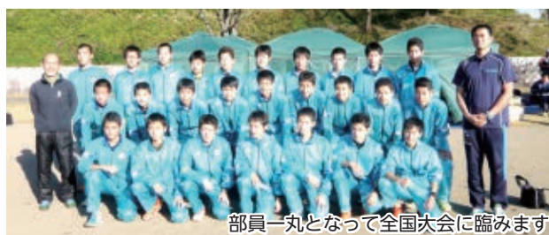
部員一丸となって全国大会に臨みます