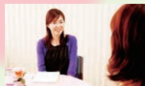
▶5月中旬、全市立小学校にスクールカウンセラーを配置。