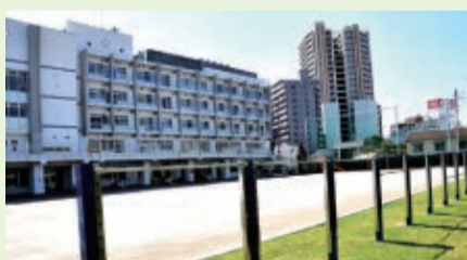
▲9月30日、船橋小学校の地上6階建ての新校舎が完成。