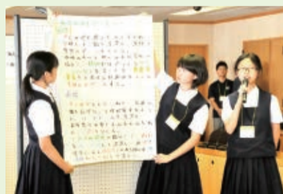
◀市長と市内全28中学校の代表が船橋について語り合う「こども未来会議室」が夏休みに開催されました。