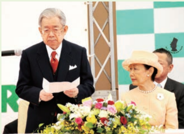
4月6日、デンマーク王国オーデンセ市との姉妹都市提携25周年記念式典がアンデルセン公園で行われ、常陸宮同妃両殿下がご臨席されました。

市のデータ 人口 619,517人(303人増) 世帯 272,842(228増) 男 310,957人 面積 85.64km 2 女 308,560人 (平成26年11月1日現在)※増減は前月比