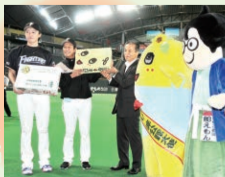
▲8月22日、23日に札幌ドームなどで「船橋のなし」をPR。

広報マンが写真で記録！ 船橋この一年 今年も残りあとわずかとなりました。今回は、広報課が今年撮影した写真とともに、一年を振り返ります。