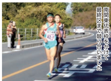
南関東代表権をかけて最終区まで競り合いました

すでに千葉県代表として全国大会への出場を決めている女子とともに、13年ぶりのアベック出場をする市船に熱い声援を送りましょう。