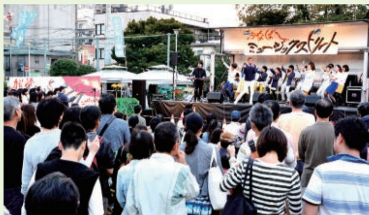
10月26日に「ふなばしミュージックストリート」を初開催。