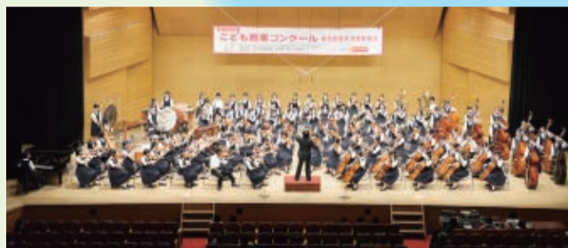
◀1月のこども音楽コンクールで葛飾中学校(写真)と高根東小学校が日本一。10・11月の全国大会でも市内4校が日本一に(8面参照)。