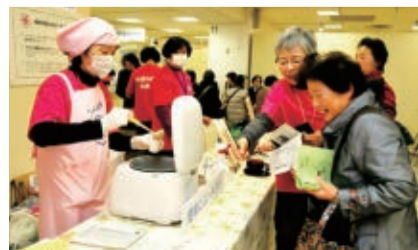
▲適塩みそ汁の試飲コーナー