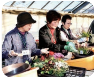
▲冬の草花を使って寄せ植えを作りました(園芸学科)

〈学科・定員・日時・内容〉下表 〈主な会場〉○スポーツコミュニケーション学科⇨中央公民館 ○パソコン学科⇨視聴覚センター ○陶芸学科⇨総合教育センター ○園芸学科⇨アンデルセン公園 ○その他の学科⇨ふなばし市民大学校