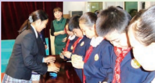
10月22日、中国・西安市で友好都市提携20周年を祝う式典が行われ、子どもたちも交流を深めました。