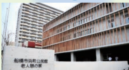
▲新・浜町公民館(写真)が6月25日に開館。また、9月には新・北部公民館と豊富出張所もオープンしました。