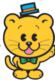
千葉県明るい選挙 シンボルキャラクター 「せんぎょ君」