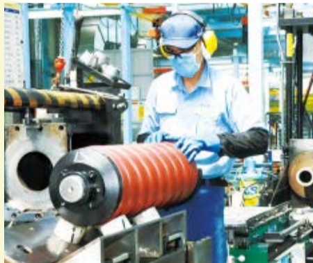
▲油圧ショベルなどの振動をやわらげる大型の鉄製パネ

重量800トンを超える超大型ショベルの場合、部品もかなりの大きさとなり1つのパネで1500キログラムを超えるものもあります。卓越した技術に加え、巨大な部品を製造するための積極的な設備導入を行っていることが多田機工の強みです。