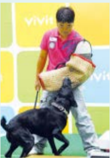
警察犬訓練士による実演▶