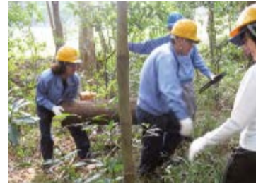
▲森の保全活動を行う社員