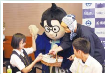
▲船えもんからふなばし産品ブランド「船橋ばか面おどり」の人形焼きの差し入れも

船橋の未来について子どもたちと直接意見を交わすことで、まちづくりとはどういうものなのかを伝えることができたと思います。この会議室で、今の中学生は船橋をいろいろな角度から見てくれていることを実感できました。子どもならではの発想のものから、現実をしっかりと見据えたものまで、提案してくれたアイデアは担当課としっかりと協議し、可能なものは実現させていきます。