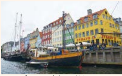
▲アンデルセンが愛した首都コペンハーゲンのニューハウズ

本市と姉妹都市提携25周年を迎えたデンマーク・オーデンセ市。今回は、それを記念してデンマーク王国大使館より公使参事官をお招きし、デンマークの政治、経済、文化、観光などについて幅広くお話していただきます。