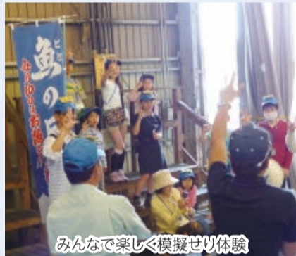
みんなで楽しく模擬せり体験

▶9月20日(土)午前8時20分～10時30分 会市地方卸売市場 内模擬せり体験、マイナス50℃の冷凍庫体験ほか 定40人(多数は抽選) 申9月6日(土)(必着)までに、ハガキに住所、電話番号、参加人数、参加者全員の氏名(ふりがな)・年齢・性別を書いて、市場総務課(〒273-0001市場1-8-1 ☎424-1151)へ