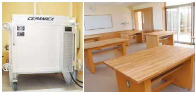
▲要望の多かった電気窯を設置。本格的な陶芸が楽しめます