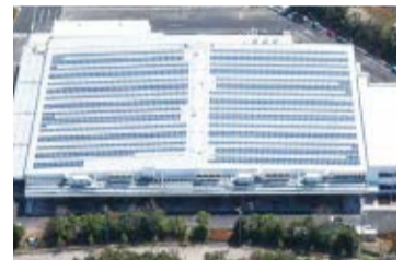
▲屋上の全面に太陽光パネルが設置されています

そのほかに、地域貢献活動として工場に隣接する「豊富どんぐりの森」の保全活動にも参加しています。平成24年から社員が定期的に草刈りやごみの撤去などの森の手入れに協力し、取り組み当初に比べ森は見違えるほど明るくきれいになりました。