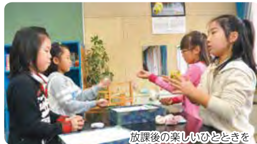
放課後の楽しいひとときを