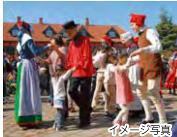
◆楽しみながら国際交流できるデンマークフォークダンス

▶きりがみ展 5月6日(休)まで/きりがみコンクールの第1次審査通過作品や、切り紙作家の作品を展示/子ども美術館 ☎457-6661