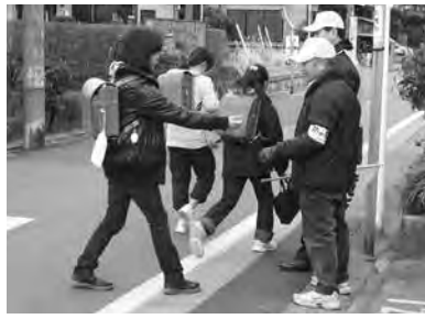
▲地域防犯の強い味方です

しかし、痴漢に遭ったり、不審者に声をかけられたりするなどの被害は、依然として起きています。子どもたちの安全を守るためには、さらに多くの見守る「目」が必要で、皆さんの活動が安心できる環境づくりの大きな支えになります。