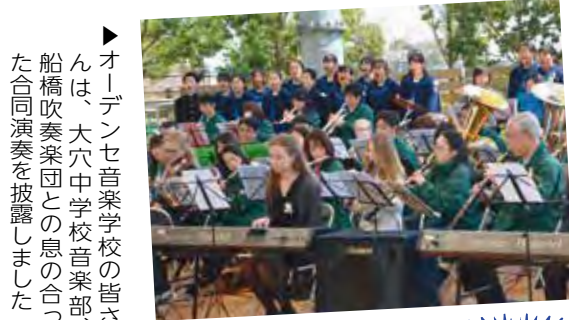
▶ オーデンセ音楽学校の皆さんは、大穴中学校音楽部、船橋吹奏楽団との息の合った合同演奏を披露しました