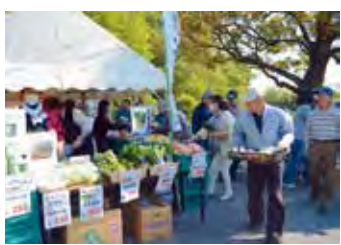
▲地元の新鮮な野菜が並びます