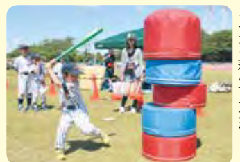
▶つまく落とせるかな

▶野球体験教室 受付 午前10時30分~ / 野球場 / 小学1年~4年生 / 当日先着20人 / 無料