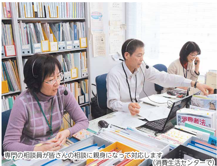
専門の相談員が皆さんの相談に親身になって対応します。(消費生活センターで)