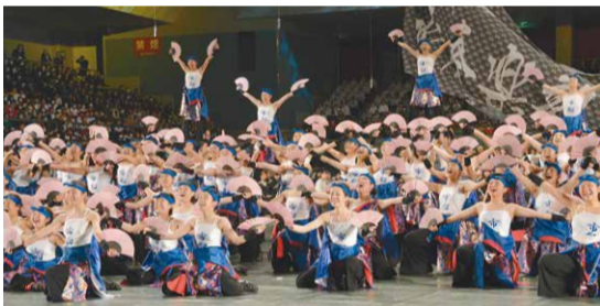
◀市立船橋高校のよさこいの迫力は圧巻!