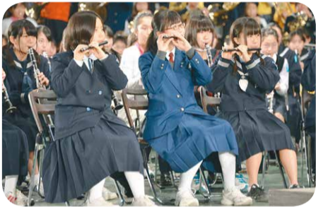
真剣なまなざしで心のこもった演奏を披露