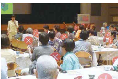
◎クイズに答え、楽しく正しい知識を学べます(まちづくり出前講座)