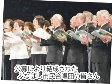
公募により結成されたふなばし市民合唱団の皆さん

なお、各公民館などでも、2月の“音楽月間”にちなんで催しが行われています。詳しくは、各施設へお問い合わせください。