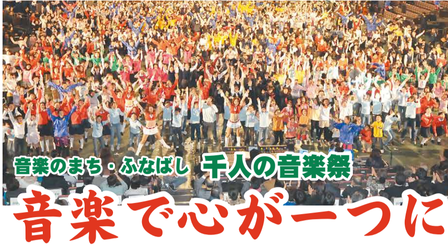
音楽のまち・ふなばし 千人の音楽祭