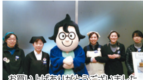
お買い上げありがとうございました