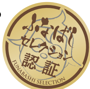
ふなばし産品ブランド認証マーク