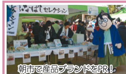
朝市で産品ブランドをPR!