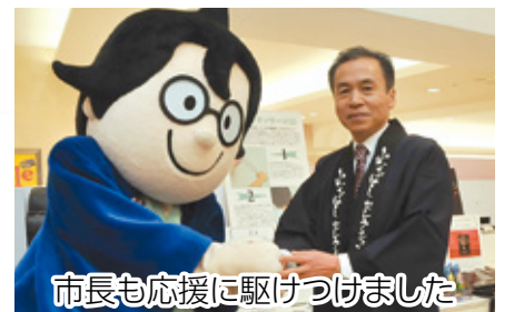
市長も応援に駆けつけました