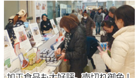
加工食品も大好評。売切れ御免!