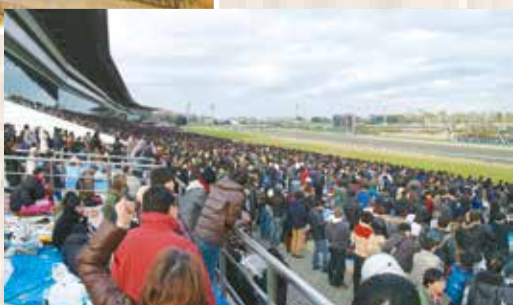
▶昭和29年に日本中央競馬会中山競馬場となり現在に至ります。有馬記念や皐月賞などの重賞レースが開催され、たくさんの人が駆けつけます(現在の中山競馬場)