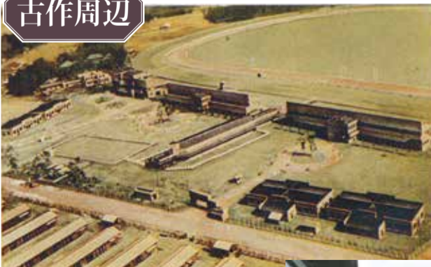
◀昭和3年の中山競馬場(当時発行された絵はがきより)。昭和2年に市外から現在の場所(古作)に移転しました。19年に戦争のため一度廃止されましたが、23年に国営競馬場として再開しました