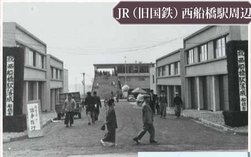
▲昭和33年11月10日、地元住民の長年の願いがかない、「国鉄西船橋駅」が落成。高い建物はまだなく、車も少なかったようです