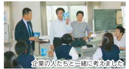
企業の人たちと一緒に考えました

なお、右記の日程で販売会を行います。今後、定期販売場所が決まりましたら、随時お知らせします。