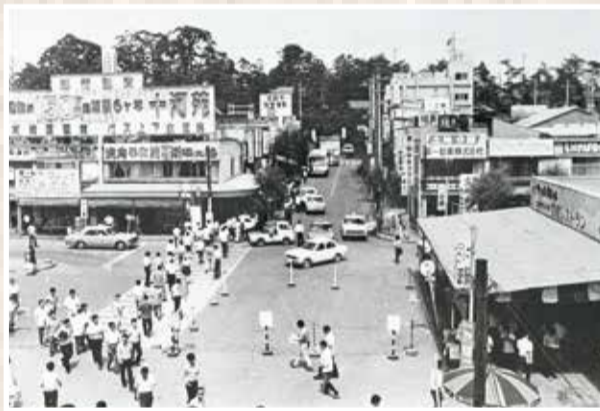
◀昭和45年の西船橋駅北口前の様子。建物が立ち並び、たくさんの人や車で活気にあふれています

小学生のころ、豊かな自然の中で楽しく遊び回っていたことが、とても懐かしい思い出です。