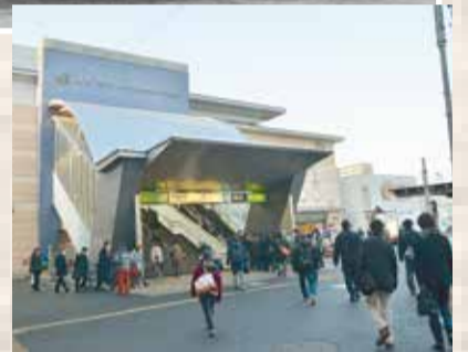
▶現在の西船橋駅北口。一日の乗降者数が30万人を超えるほどにまで発展しました