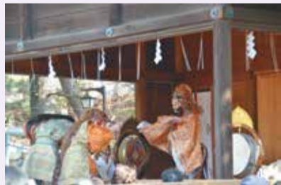
▲おごそかな雰囲気での華麗な舞も節分祭の見どころ(昨年の船橋大神宮で)