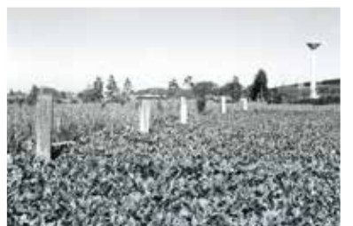
古作に広がる畑。右後方に見えるのは中山競馬場です(昭和30～40年代)