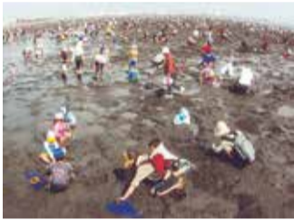
◀前回の理事長賞受賞作品

<テーマ> ○三番瀬部門⇨三番瀬に生息する生き物や風景など ○富士山部門⇨公園から撮影した富士山※いずれも公園内で撮影した、未発表作品に限ります <サイズ> 四つ切またはワイド四つ切 <審査員> 鈴木正美氏(写真家)、森沢明夫氏(作家)ほか <賞・賞金> ○理事長賞(1点) ⇨5万円 ○大賞(各部門1点) ⇨3万円 ○入選(各部門2