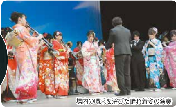
場内の喝采を浴びた晴れ着姿の演奏