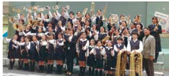
▲文京シビックホール(東京都)で開催された日本管楽合奏コンテストで、最優秀賞を受賞した高根東小学校音楽部