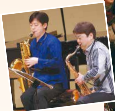
▲生の迫力を毎年、間近で体験できることが魅力です