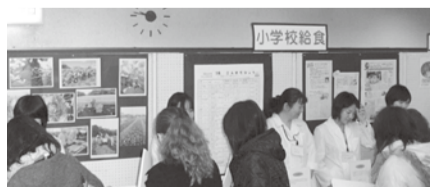
各学校の給食を紹介するパネル展示も