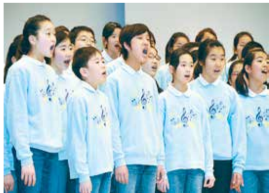
音楽で活躍する市内の小・中・高等学校が集まりハーモニーを奏でる「夢を育む虹のコンサート」

——ほかに、毎年行われている千人の音楽祭も、市内アマチュアの音楽家が集まって、自分たちの手で企画・運営を行っているそうですね。