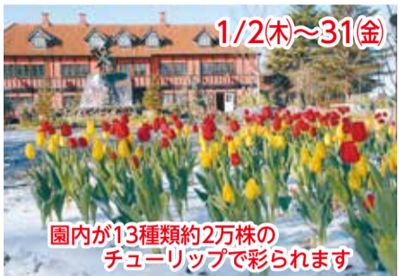
園内が13種類約2万株のチューリップで彩られます

❑1月の休園日 毎週月(13日(祝)は開園)、1日(祝) ❑園内では真冬に開花させる約2万株のチューリップが見ごろを迎えるほか、「パンジー・ビオラ100選」を開催。