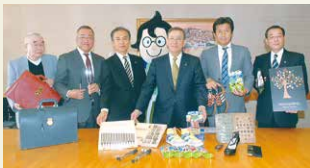
▲12月12日、セレクションで選ばれた出品者が市役所で一堂に会し、認証式が行われました

船橋ならではの優れた産品をブランド化する取り組み「ふなばしセレクション」。 第二弾となる今年度は、「工業製品・工芸品」を募集しました。多数の応募があり、厳正な審査の結果、4製品を新たに認証しました。今後は、ふなばし朝市、百貨店での催事販売などで広くPRしていきます。 ■商品の詳細や販売店舗などは、2月中旬に発行する広報ふなばし特集号でお知らせするほか、ホームページ( http://www.funamon.com/ )でも紹介しています。 ☎ ふなばし産品ブランド協議会 (商工振興課内) ☎436・2472