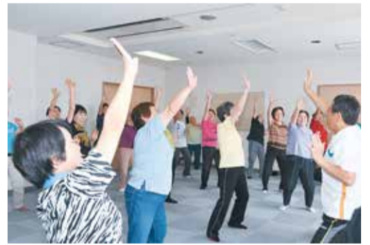
いつまでも元気で過ごすために（南老人福祉センターの体操教室で）

ちよっと大きな夢ですが、世界地図に「FUNABASHI」と載るくらい世界の人に認知されるまちにしていきたいです。世界に向けての発信力も強めていきたいです。