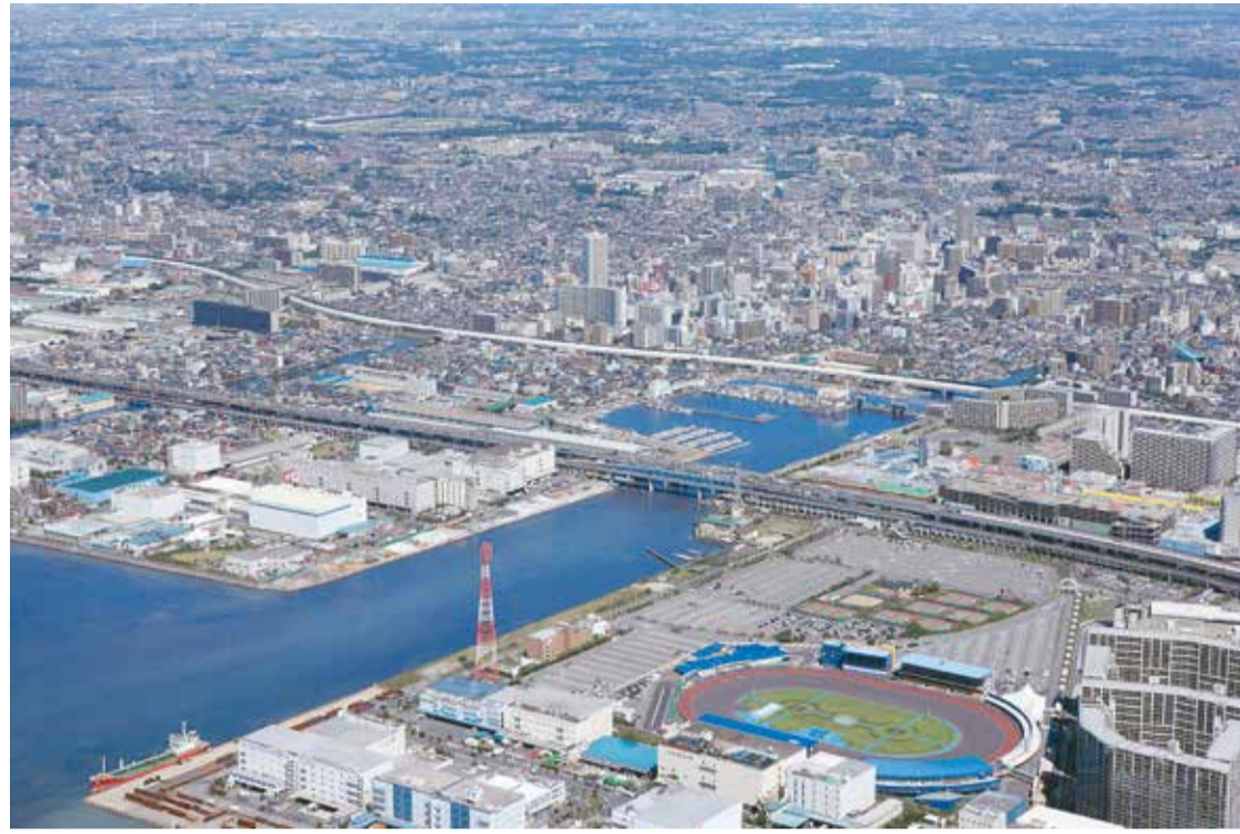
市内の多様な産業は、市民生活の大きな支えとなり、都市の魅力や活力を生みます — 船橋港、市街地を望む