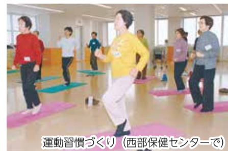
運動習慣づくり(西部保健センターで)

□教室名・日時・会場下表(①③各全2回、②全4回) 対象市内在住で今年度初めて教室に参加する人 定員各先着25人 費用無料 申込み希望する各保健センターへ