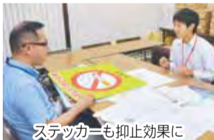
ステッカーも抑止効果に

喫煙者の人もポイ捨てなどのマナー違反を見かけると、良い気分にはならないと思います。マナーを守った喫煙で、みんなが気持ち良く過ごせるまちになってほしいです。