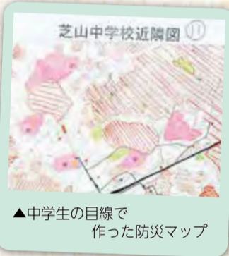
▲中学生の目線で作った防災マップ