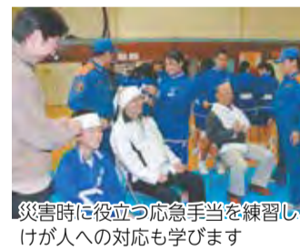
災害時に役立つ応急手当を練習し、けが人への対応も学びます

市では、17年度から市内の中学生を対象に、防災学習を行っています。これは、中学生に自らを守る力、また、高齢者や手助けが必要な人たちを支援できる力を付けてもらうことを目的としています。また、地域の人とともに活動することで、いざというときに協力し合える関係づくりの強化も目指しています。