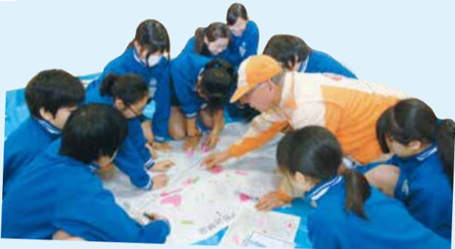
災害時に地域がどんな状態になるのかを考えるため、危険箇所や消火栓・AEDの位置などを書き込み、地図を作成しました。