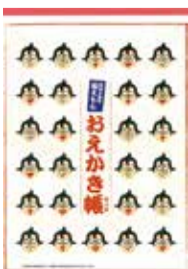
船えもんのおえかき帳などを プレゼントします

〈問合せ〉 船橋市地域工業 団体連合会事務局(商工振 興課内) ☎436・2474