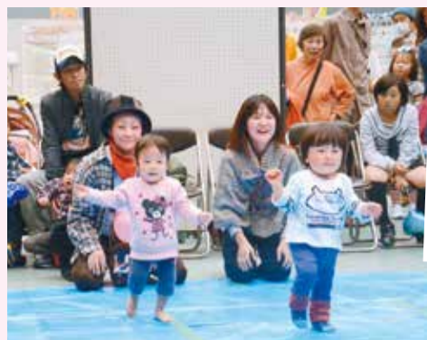
▲健康・医療について医師に 相談してみませんか

□日時 11月9日(土)正午～ 午後3時 会場 北消防署 行田分署 内容 消防庁舎 や消防車両を利用した9 つの体験と火災予防相談 コーナー 問合せ 北消防 署 ☎438・22338