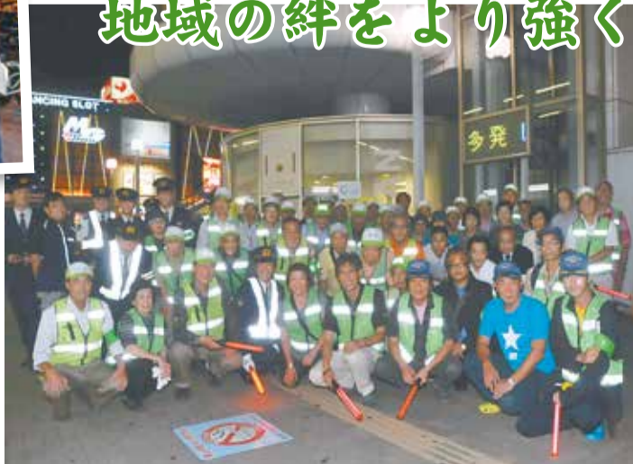
▶10月10日の防犯パトロールには66人が参加。日ごろのチームワークの良さで、駅周辺の安全を守っています