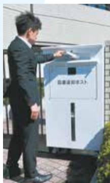
▲通勤の途中、手軽に立ち寄れます