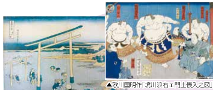
▲歌川国明作「境川浪右エ門土俵入之図」 ▲葛飾北斎作「富嶽三十六景 登戸浦」

11月2日(土)、3日(日)各午前9時30分～午後4時30分 / 図書館で利用されなくなった図書を1人10冊まで無料で提供 / 北図書館 ☎448-4899