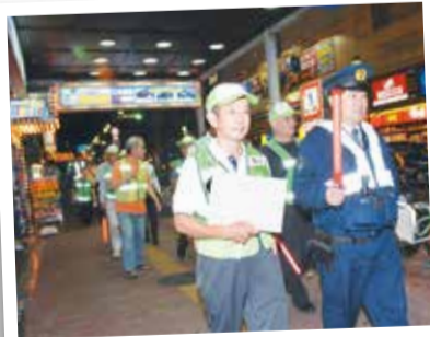
▲パトロールは地域の皆さんが一体となった取り組みです