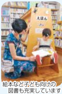
絵本など子ども向けの図書も充実しています

〈開室時間〉午前10時30分～午後4時30分(塚田・丸山・小室公民館は午後1時から) 〈休室日〉(月)(祝)(休)、毎月最終(木)※(祝)が(日)(月)と重なったときは(月)と次の平日が休み