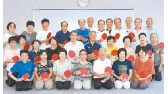
明るく、いきいき健康づくり！最高齢89歳、69人の 会員が加入し、和気あいあいとした雰囲気の中卓球 を楽しみます(南老人福祉センター卓球クラブの皆さん)