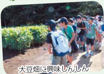
大豆畑に興味しんしん