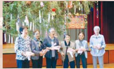
▲皆さんに喜ばれている季節のイベントも開催(高尾地区社会福祉協議会のミニ・デイ・イベント)