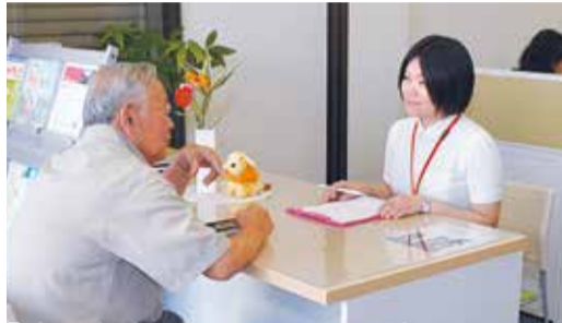
「どこに相談してよいかわからない」 — お近くの地域包括支援センター、または在宅介護支援 センターへご相談を(法典地域包括支援センターで)

市では、年齢を重ねても安心して暮らしてい けるよう、さまざまな高齢者福祉サービスを行 っています。高齢者の方や介護をしている家 族の方など、ぜひご利用ください。