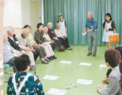
▲ゲームでのコミュニケーションは介護予防にも役立ちます(本中山地区社会福祉協議会いきいきサロンで)

▼詳しい内容などは(社福)船橋市社会福祉協議会 ☎431-2653へお問い合わせください。