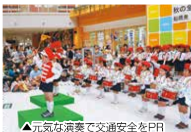
▲元氣な演奏で交通安全をPR(昨年のキャンペーンで)

秋口は日没時間が急速に早まり、夕暮れ時や夜の間の交通事故が多くなっています。交通ルールを守り、正しいマナーを実践しましょう。