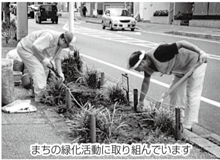
まちの緑化活動に取り組んでいます

〈応募方法〉10月1日(火)～11月5日(火)に、申込書を直接市民協働課へ □対象事業・団体など詳しくは募集要領をご覧ください。募集要領は市民協働課、市民活動サポートセンターで配布するほか、市ホームページからも取り出せます。