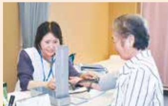
看護師が利用者の健康相談も受け付けます