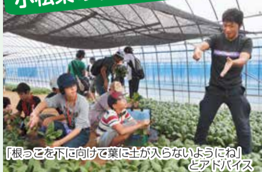
「根っこを下に向けて葉に土が入らないようにね」とアドバイス

「船橋ブランド」として小松菜を全国にアピールしている若手生産者「チームうぐいす」の皆さんに、お手本を見せてもらいながら収穫を体験。JAちば東葛西船地区経済センターでは、小松菜についての講義も受けました。