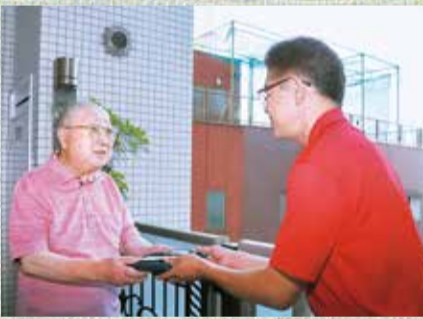
▲配食サービスでは、家族、事業者、市 が連携して、高齢者の皆さんを見守る 体制をつくっています