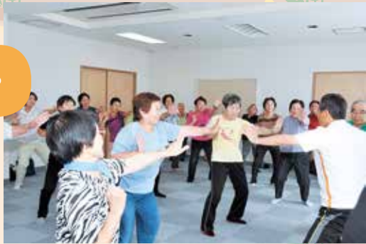
▲南老人福祉センターでは、1日平均230人が、健康づくり、おしゃべり、歌…と充実したひと時を過ごしています(写真は体操教室の様子)

※東老人福祉センターは、9月22日(日)から11月4日(休)まで空調工事のため一時休館する予定です。ご不便をおかけしますが、ご理解ご協力をお願いします