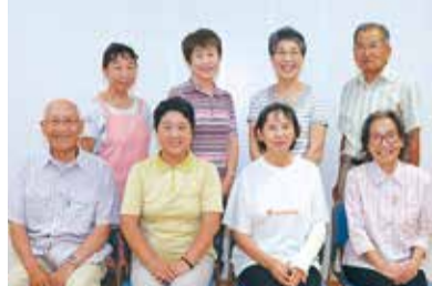
▲「好きだから続けられます」、「活動を通じて、地域の顔見知りが増えました」と会員の皆さん

同会は平成5年に発足。現在は50代から80代の26人が参加し、高齢者宅の家事援助や、介護施設での縫い物、話し相手などのさまざまなボランティア活動を行っています。