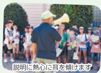
説明に熱心に耳を傾けます