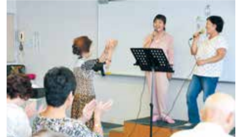
ベテラン講師による歌唱指導で、カラオケ も楽しみながら上達(老人福祉センター)

市では、年齢を重ねても安心して暮らしてい けるよう、さまざまな高齢者福祉サービスを行 っています。高齢者の方や介護をしている家 族の方など、ぜひご利用ください。