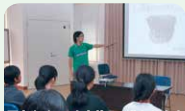
写真やイラストを使って分かりやすく説明してくれました