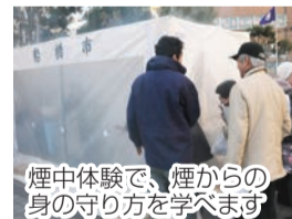
煙中体験で、煙からの身の守り方を学びます

市では、災害時の自主的な防災活動やボランティア活動の理解を深めてもらうことを目的とし、防災フェアを開催します。