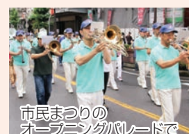
市民まつりのオープニングパレードで

☐曲目 G.ピゼー「悲劇“カルメン”より」ほか 問合せ 消防局予防課 ☎435-1114