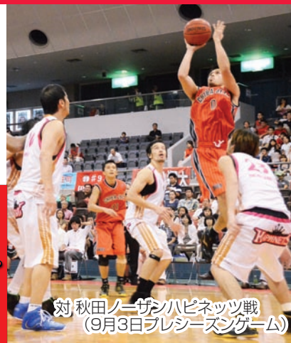
対 秋田ノーザンハピネッツ戦(9月3日プレシーズンゲーム)