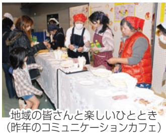
地域の皆さんと楽しいひととき(昨年のコミュニケーションカフェ)

コミュニケーションも健康にとって大切であることから、今年は人と人との結びつき(絆)をテーマに開催します。健康や医療に関する相談・展示コーナーや、スポーツ体験、体力測定など、盛りだくさん。家族や地域の皆さんと参加してみませんか。