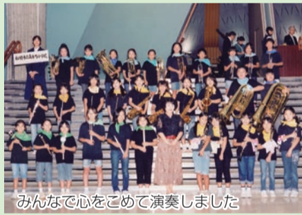
みんなで心をこめて演奏しました

部長と副部長も、「とにかくうれしい!」「6年連続で金賞がとれてよかった」と話していました。また、指揮の朝妻先生は、「みんなで夏休みもがんばって練習したからだね」と言ってくれました。私も小学校生活最後の年に、仲間とのいい思い出ができて本当によかったです。