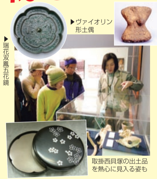
▶ ヴァイオリン形土偶