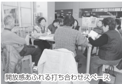
開放感あふれる打ち合わせスペース

また、インターネットを通じて市民活動の様子やイベントの案内等を紹介する「かなばし市民活動情報ネット」での情報発信もできるようになります。このように、日々の活動の様子を、より多くの皆さんにお知らせできます。なお、登録がなくても施設の利用はできますが、登録団体が優先される場合があります。