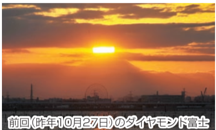
前回(昨年10月27日)のダイヤモンド富士

■2月の休園日 毎週月 ▶シーサイドアトリエ ○2月6日(日)⇒三番瀬キャンドル(500円)、○20日(日)⇒レザークラフト(300円)/各午前10時～午後3時/海浜公園でとれた貝殻などを使った工作教室/小学生以上/各当日先着50人 ▶ダイヤモンド富士を見よう 2月15日(火)午後5時10分ごろ/気象条件が整えば、富士山頂へと沈む夕日がダイヤモンドのように輝く光景が見られます