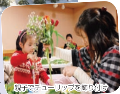
親子でチューリップを飾り付け

1月16日未明、市内でも雪が降り、アンデルセン公園内を彩る花々も雪のベールに覆われました。この日、園内では「チューリップのブーケづくり」が開催され、家族連れなど20組約40人が参加。制作した花束にみんな大満足の様子で、白い帽子を被った真冬のチューリップとともに、冬のアンデルセン公園を満喫していました。