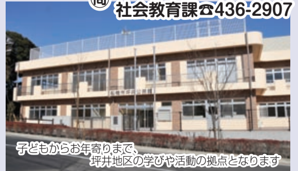
子どもからお年寄りまで、坪井地区の学びや活動の拠点となります