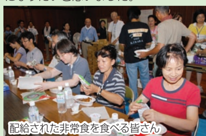
配給された非常食を食べる皆さん

各国には風習の違いがあるので、みんなで訓練をするのは難しいそうです。災害時には、「災害多言語支援センター」も必要と聞きました。この訓練を通じて、私もいろいろな人々を助けられるようになりたいと思いました。