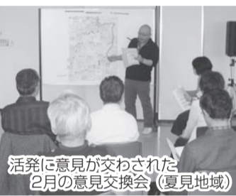
活発に意見が交わされた 2月の意見交換会(夏見地域)

しかし、策定から9年が経過し、現在の社会状況に合わせる必要があるため、23年度に改訂を予定しています。