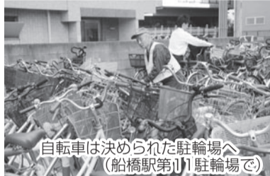
自転車は決められた駐輪場へ (船橋駅第11駐輪場)