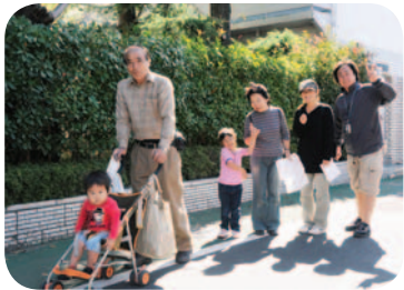
▲ゴールを目指して一斉同結(昨年のウォークラリー)

□参加費300円(小・中学生100円) 問合せスポーツの祭典実行委員会・渡邊 ☎090-1731-8540 ■各出発地点には小旗を持ったスタッフが待っています。