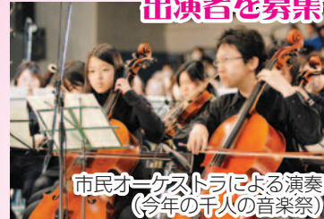
市民オーケストラによる演奏(今年の千人の音楽祭)

□開催日時 23年1月30日(日) 午後1時～ 会場 船橋アリーナ 募集内容 ○管楽器・弦楽器奏者 ○合唱団員 募集人数 各先着30人 申込み 同実行委員会事務局(文化課内) ☎436-2894へ ※曲目・練習日程等は後日お知らせします