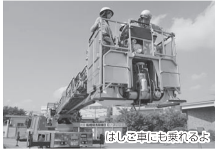
はしご車にも乗れるよ

☎日時10月16日(土)午前10時～午後2時 ※雨天中止 会場 船橋競馬場(若松1) 内容 消防体験コーナー、模擬店、フリーマーケットほか 問合せ 同実行委員会☎435-8628