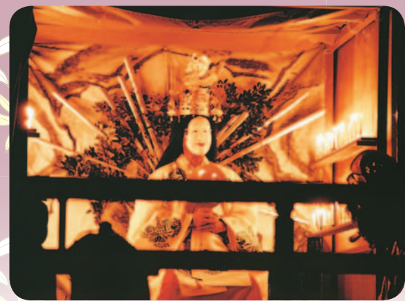
▲高根町神明社の神楽「天の岩戸舞」。ここでは10月15日だけに舞われる、幻想的な曲目です