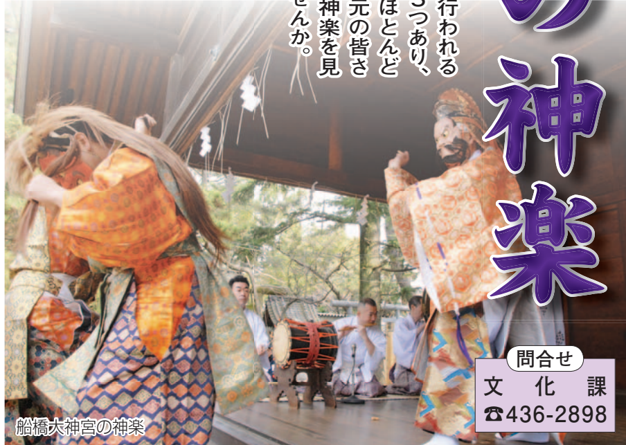
船橋大神宮の神楽