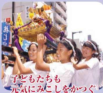
子どもたちも 元気にみこしをかつぐ