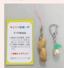
▲チーバくんマスコット