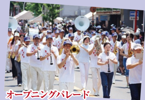
オープニングパレード

7月28日に開催予定だった船橋港親水公園花火大会は、29日の順延日も含め、荒天のため中止となりました。