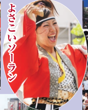
よさこいソーラン