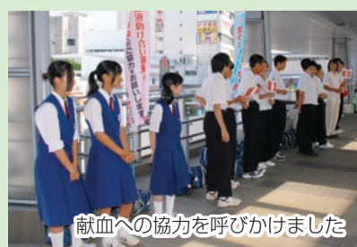
献血への協力を呼びかけました