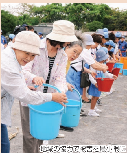
地域の協力で被害を最小限に

サイレンとともに 最寄りの避難所へ 8月29日(日)、全市立小学校と特別支援学校高根台校舎、船橋中学校に避難所を開設します。 午前9時20分に、防災行政無線でサイレンを鳴らします。それを合図に、最寄りの小学校などに避難してください。 各避難所では非常参集