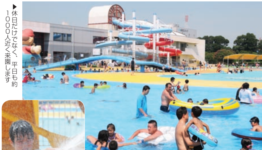
▶休日だけでなく、平日も約1000人近く来園します