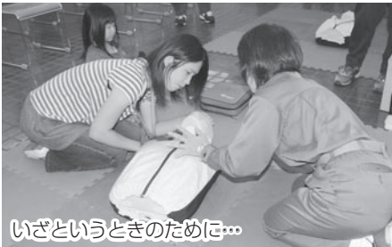
いざというときのために...

□日時8月7日(土)午前9時～午後5時 会場救急ステーション(医療センター隣) 内容心肺蘇生法(成人・小児・乳児)、外傷の応急手当ほか 対象市内在住・在勤・在学の18～65歳の人 定員先着30人 費用無料 申込み8月2日(月)から消防局救急課 ☎435-1191へ