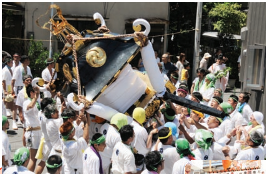
▲当番町会の浜町東で神輿をゆすり込む