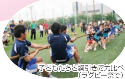
子どもたちと綱引きで力比べ (ラグビー祭で)

▶問合せ ☎03-3245-3080 ▶ホームページ http://www.kubota-spears.com/