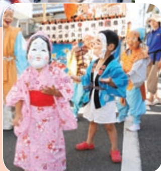
▲ばか面踊りを披露

船橋大神宮内にある八剱神社の本祭りが、7月16日から19日まで漁師町(湊町・浜町・本町・日の出)で行われました。この祭りは江戸時代から続くもので、神輿をもめばもむほど、漁師町が繁栄したと伝えられ、「ゆすり込み」として受け継がれています。3年に一度の本祭りは大勢の人たちで賑わい、見に来た人は「迫力あるゆすり込みに圧倒されました」と話してくれました。