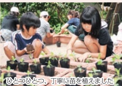
ひとつひとつ、丁寧に苗を植えました

千葉国体の開催時に全国から訪れる人々をきれいな花で迎えようと、「花いっぱい運動」が始まりました。これは市民ボランティアと市内各小学校・市立船橋特別支援学校・児童ホームの子どもたちが、ニチニチソウやマリーゴールドなどの「おもてなしの花」を育て、国体本番に競技会場や市内各地を飾るものです。