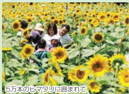
5万本のヒマワリに囲まれて

迷路は金杉小学校の児童が、種まきから草ぬきまで、一生懸命やってきました。また、JAのみなさん、地域の人やお母さん、お父さんたちも手伝ってくれました。当日は晴天にめぐまれ、お客さんに楽しんでもらうことを願って、3年生もがんばっていました。たくさんのお客さんが来てくれて、金杉のヒマワリを見て喜んでくれたことが本当にうれしいです。私は金杉小に咲く5万本のヒマワリが大好きです！