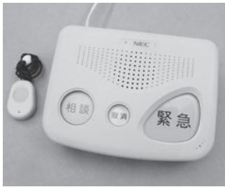
▲緊急通報装置(右)と無線送信機

65歳以上で持病などがあ り、常に安否の確認が必要 ひとり暮らし高齢者等に、緊 急通報装置を貸し出していま