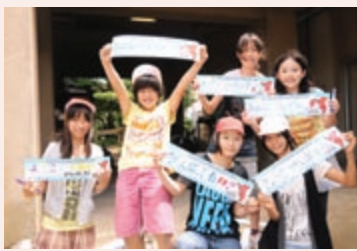
みんなに届け、私たちのメッセージ!

また花だけではなく、選手への応援や、船橋を訪れる人への歓迎の言葉をシールに書き、プランターに貼ります。 7月14日に苗の植え付けを行った行田東小学校の子どもたちは、「枯らせないように、みんなで大切に育てます」「自分の書いたメッセージが、選手を元気づけられたらうれしいな」と話してくれました。