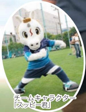
チームキャラクター 「スピキー君」