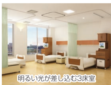
明るい光が差し込む3床室

E館4階にある緩和ケア病棟には、3床室が2つと14の個室があり、合わせて20床を整備しました。また、家族が宿泊できる部屋(2室)も用意されています。5階には緩和ケア内科外来や屋上庭園、ラウンジを設置するなど、患者と家族が穏やかに過ごせるような様々な配慮をしています。