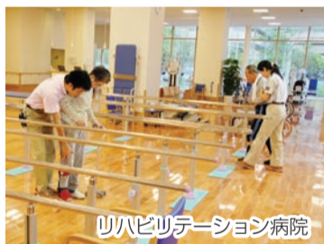
リハビリテーション病院

医療センターは昭和58年に、高度医療、救急医療の先進的な役割を担う基幹病院として開院しました。平成6年には、それまでの救急医療実績が評価され、脳卒中など重篤な患者に対応する三次救急を担う「救命救急センター」を、東葛南部保健医療圏で初めて開設。市医師会の協力のもと、全国で初めてとなる