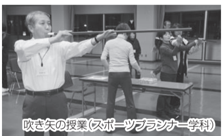
吹き矢の授業(スポーツプランナー学科)

4月から、ふなばしの魅力を再発見する「ふなばしマイスター学科」を新設します。 □学科・定員・日時 右上表 対象 市内在住で、4月1日現在、下記の年齢の人 ※各学科等の受講・修了生などは不可。詳しくはお問い合わせください