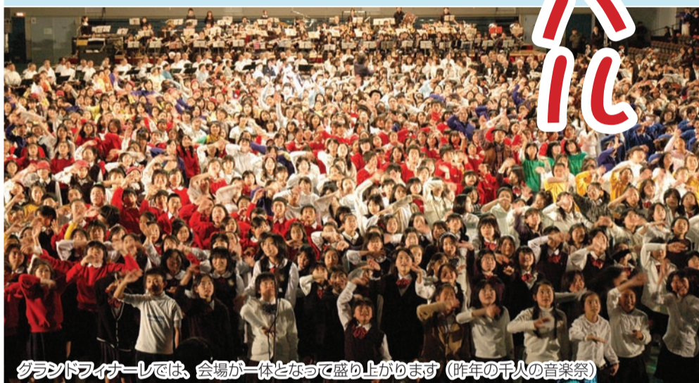
グランドフィナーレでは、会場が一体となって盛り上がります（昨年の千人の音楽祭）