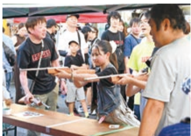
▲射的を楽しむ子どもたち

〈日程〉9月26日(土) 〈会場〉本町・宮本通り 〈対象〉市内在住・在勤・在学の個人または団体 〈募集数〉200店舗程度(多数は抽選) 〈費用〉4000円～※食品の調理販売は6000円～ 〈申込み〉6月30日(火)(必着)までに市ホームページ(下コード)からオンライン申請※申込書類を商工振興課(〒273-8501※住所不要)へ郵送または持参も可