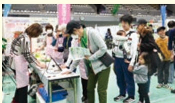
▲屋内イベントの様子

〈協賛金〉1口(5000円)以上※グッズや食品等は事務局までご連絡ください 〈申込み〉7月31日(金)(必着)までに申請書を申込先へ