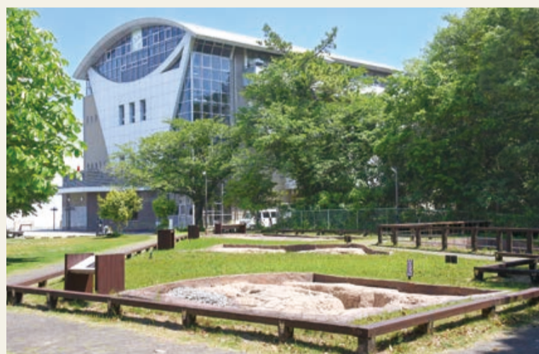
▲隣接する史跡公園では、貝塚や炉穴(屋外の調理場)等を復元した展示が壮大なスケールで楽しめます

みんなで何をのぞき込んでいるんだろう…? ▲同博物館のゆるキャラ「エビゾーくん」 答えは2面へ