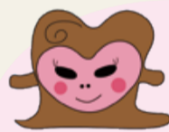
▲同博物館のゆるキャラ「とってちゃん」