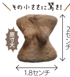
その小ささに驚き! 原寸大 2センチ 1.8センチ

市北東部の小室上台遺跡で発掘された、日本最古級・最小級の「バイオリン形土偶」。約1万1000年前に作られた重さ2.5グラムの土偶は、平成30(2018)年には、フランスのパリで開催された縄文展でも展示されました。