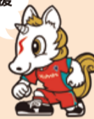
▲クボタスピアーズ船橋・東京ベイ公式マスコットキャラクター「スッピー」