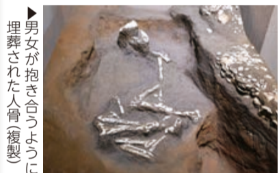
▶男女が抱き合うように埋葬された人骨(複製)