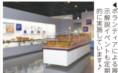
▶ポランテアによる展示解説イベントも定期的に実施しています