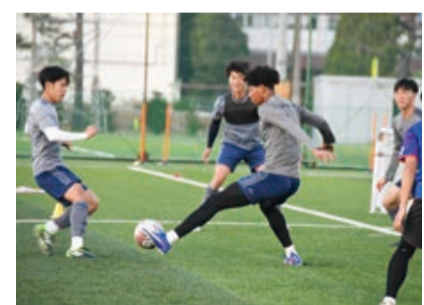
▲練習でも光る対人守備

れるよう日々の練習や試合をひとつ高い意識で臨むようにしていると話す姿は、すでにプロとしてのオーラをまとっていた。さらなる成長を求め、歩みを止めない大きな背中に、これからも声援を送りたい。