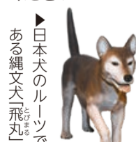
▲日本犬のルーツである縄文犬「飛ノ丸」

〈アクセス〉東武アーバンパークライン新船橋駅から徒歩約8分、東葉高速線東海神駅から徒歩約12分、京成本線海神駅から徒歩約15分、またはJR船橋駅北口から京成バス千葉ウエスト山手ループ線に乗り「海神中学校前」で下車徒歩約1分