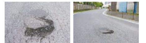
▲損傷状況写真(近景・遠景)

☎道路維持課 ☎436-2618 ☎通報方法など、詳しくは市ホームページ(右コード)をご覧ください。