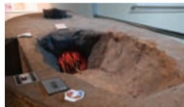
▲炉穴では土器を使って煮ています。炊きをしていました

館内の2階では「飛ノ台貝塚」を紹介し、▲炉穴では土器を使って煮ています。炊きをしていました。同貝塚は、昭和初期に炉穴が日本で最初に発見されたことでも有名な遺跡です。炉穴は、縄文人が屋外で調理をした跡で、同貝塚では400基以上が見つっています。