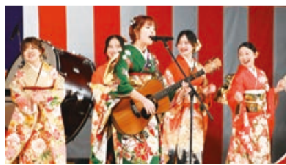
▲演奏を披露する新成人の皆さん

令和9年成人式の開催概要が決定しました。また、自らの手で成人式を盛り上げる企画運営委員を募集します。