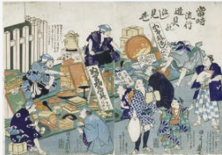
▲歌川芳藤(当時流行道具のほし見世) 明治元(1868)年

市所蔵作品展を5月21日(木)から31日(日)まで、市民ギャラリーで開催します。浮世絵は「美術作品」として広く認識されていますが、江戸・明治期にはビジュアルイメージとして物事を伝えることができる重要な媒体でした。今回は、構図や手法に注目して厳選した約20点の浮世絵を紹介し、写真作品等も併せて展示します。浮世絵師は、さまざまな表現によって、一体何を伝えようとしたのか。ぜひ、描かれた「浮世」をお楽しみください。