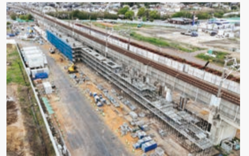
▲築造が進む高架橋

東葉高速線の新駅は、令和10年度末の開業を目指しています。駅舎やプラットホームを支える高架橋の基礎工事がおおむね完了し、現在は柱の築造が順調に進んでいます。