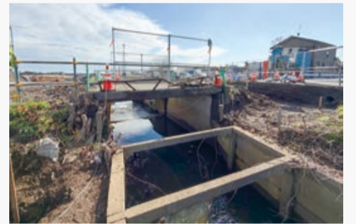
▲架け替え前の念田橋

令和11年度にかけて、道路や公園、調整池等の都市基盤を整備していきます。現在は、区域の西側を流れる念田川に架かる念田橋の架け替え工事等の施工中です。