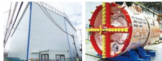
▲発進基地防音建屋(左写真)からシールドマシン(右写真)でトンネルを掘ります

局地的な大雨などによる浸水被害を軽減し、安全で安心な都市を形成するため、雨水整備計画に基づき優先的に整備を行う地区を選定し、下水道管(雨水)の整備を行います。