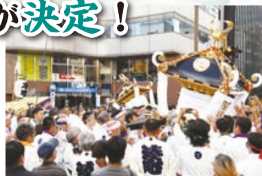
▲本町・湊町みこしのゆすり込み

今年も「ふなばし市民まつり」を開催します。また「めいど・いん・ふなばし」の一部イベントを、7月25日(土)に先行開催します。詳細は決まり次第、お知らせします。