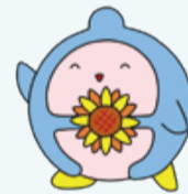
▲ふなエコマスコットキャラクター「ふなわりくん」

日本では年間約464万トンの食品ロスが発生しており、これは1人当たり毎日おにぎり1個分の食品を捨てていることになります。この食品ロス分の廃棄にも二酸化炭素が排出されます。家にある食材を確認してから買い物するなど、食品ロスを減らしましょう。