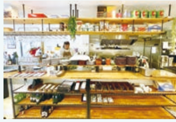
補助金を活用した飲食店の内装

〈対象業種〉中小企業または個人事業主が行う次のいずれかに該当する事業 ○小売業、飲食業またはサービス業等、個人客が直接来店する業種の事業 ○半径500メートル内に生鮮三品(鮮魚・精肉・青果)または日用品を販売する店舗がない地域