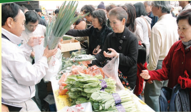
とれたての野菜を買い求める皆さん(中央卸売市場で)

船橋で盛んな都市農業や水産業を紹介。新鮮な野菜や水産物の即売、マグロの解体ショーなど楽しい催しがいっぱいです。