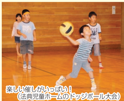
楽しい催しがいっぱい! (法典児童ホームのドッジボール大会)