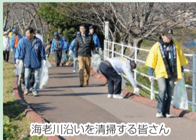
海老川沿いを清掃する皆さん

〈会場〉○中央会場(天沼弁天池公園)：会場からごみを拾いながら各集積所へ ○地区会場：道端のごみやたばこの吸い殻などを拾いながら、最寄りの小学校へ