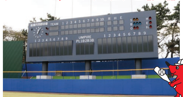
スコアボードも新しくなりました