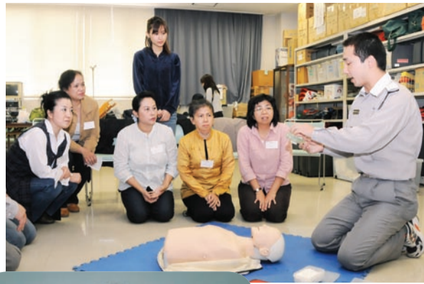
真剣なまなざしの受講者たち

10月9日、16日、23日の3日間にわたり、市消防局救急ステーションで、全国で初めてとなる「外国人のための応急手当普及員講習」が開催されました。