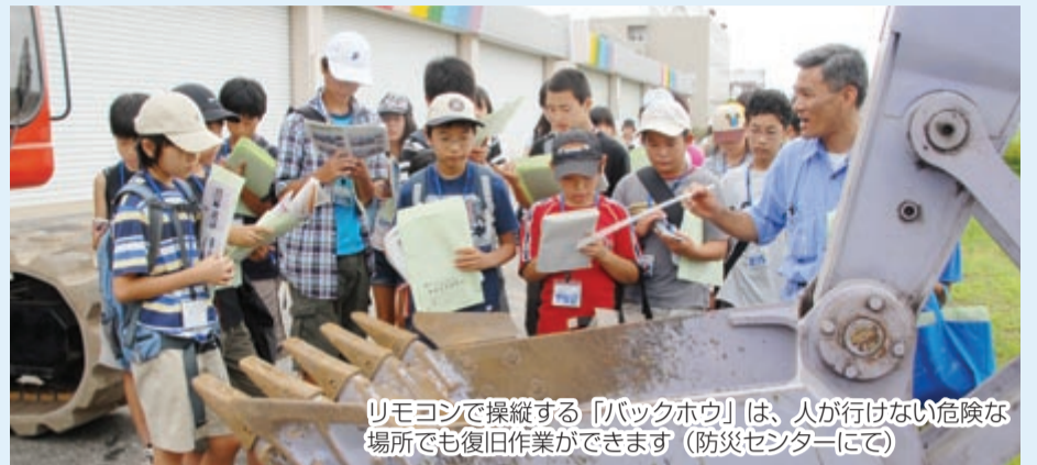
リモコンで操縦する「バックホウ」は、人が行けない危険な場所でも復旧作業ができます（防災センターにて）

8月17日、小学6年生と中学2年生の子ども記者70人が、国土交通省船橋防災センター（東船橋5）や医療センターに隣接する救急ステーション、消防局などを見学し、防災対策や救急体制などを学びました。