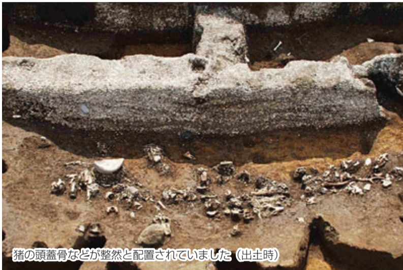
猪の頭蓋骨などが整然と配置されていました(出土時)

今回、展示する土器は、これまで主に神奈川県東部(千葉県内では君津市周辺などごく一部)で出土している、厚手で赤色味が強い「大浦山式土器」