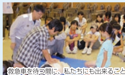
救急車を待つ間に、私たちにも出来ること