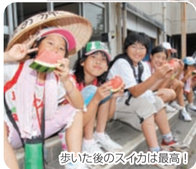
歩いた後のスイカは最高!

「歩けば歩くほど体力がつく。市内にはまだ知らないところがたくさんあった」と話してくれました。