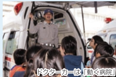
ドクターカーは「動く病院」

救急ステーションの設備やドクターカー（医者が同乗して現場に向かう救急車）を見学。