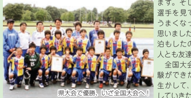
県大会で優勝、いざ全国大会へ!

全国大会は8月1日から8日までで、みんなで力を合わせて優勝目指してがんばりましたが、1勝2敗2分と、あまりいい結果を出すことができませんでした。しかし、自分たちは全力で戦って、全国でも通用するようなプレーができたと思