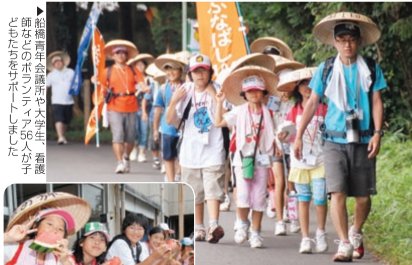
船橋青年会議所や大学生、看護師などのボランティア56人が子どもたちをサポートしました