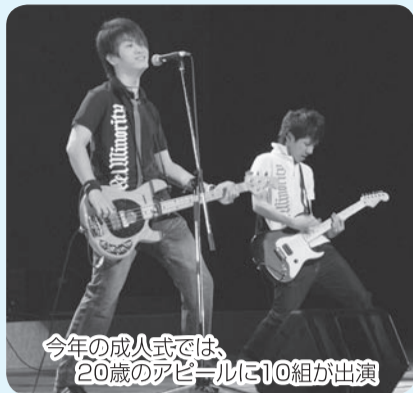
今年の成人式では、 20歳のアピールに10組が出演