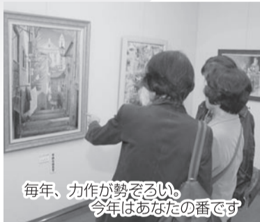
毎年、力作が勢ぞろい。 今年はあなたの番です

票を市民ギャラリーへ持参 ▶詳しくは、文化課、市民ガ ャラリー、各出張所・公民館 で配付する開催要項をご覧 ください。 〔問合せ〕文化課☎436-2894