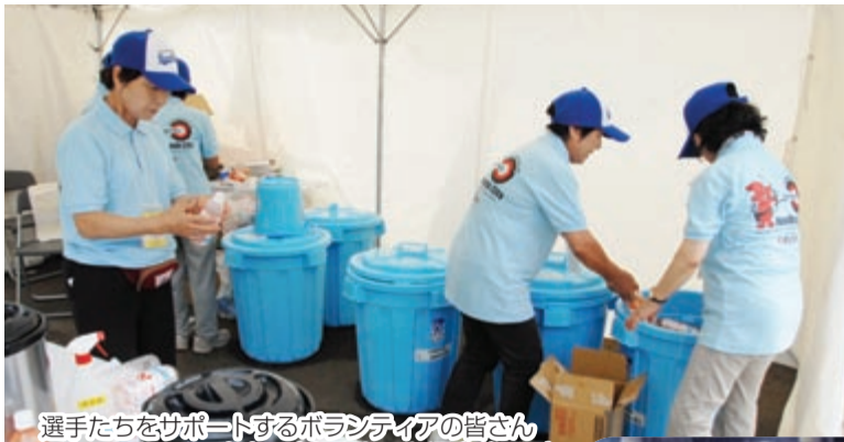
選手たちをサポートするボランティアの皆さん (アーチェリー大会の会場となった運動公園で)