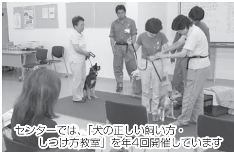
センターでは、「犬の正しい飼い方・ しつけ方教室」を年4回開催しています

票を市民ギャラリーへ持参 ▶詳しくは、文化課、市民ガ ャラリー、各出張所・公民館 で配付する開催要項をご覧 ください。 〔問合せ〕文化課☎436-2894