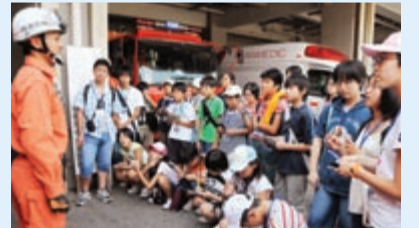
▲消防車って、色々な種類があるんだね