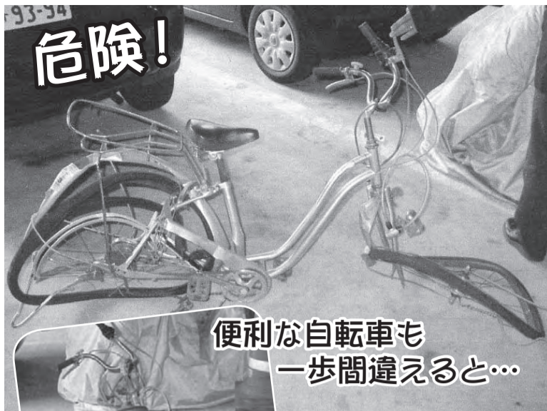
便利な自転車も一歩間違えると...