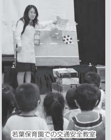
若葉保育園での交通安全教室

毎年、市内の保育園、幼稚園、小学校で交通安全教室を行っています。幼児向けの教室では、子どもたちが飽きないように、パネルシアターや紙芝居などを使って、楽しく・わかりやすく指導するよう心掛けています。