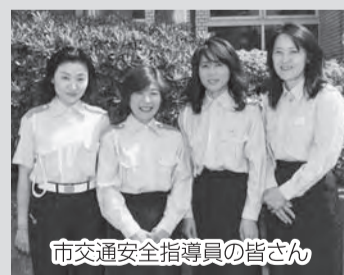
市交通安全指導員の皆さん

市では交通安全指導員による、自転車の正しい乗り方や交通ルールなどを学ぶ「交通安全教室」を、保育園や学校、老人クラブなどで開催しています。「まちづくり出前講座」のメニューには、「交通安全講座」もあります。町会・自治会など10人以上のグループで申し込みます。詳細についてはお問い合わせを。