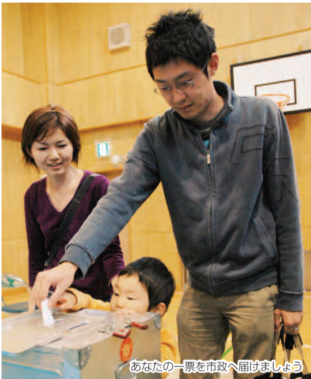
あなたの一票を市政へ届けましょう

投票できる人は… 次のすべてに該当する人で す。ただし、投票する前に市外 へ転出する人は投票できません (下表参照)。 ○平成元年6月22日までに生ま れた日本国民 ○平成21年3月13日までに船橋 市に住民票が作成されていて (転入の届け出をしていて、 6月13日現在、引き続き市内 に住所を有する人