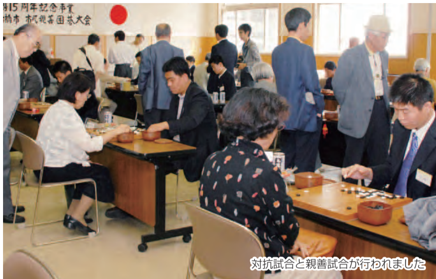
対抗試合と親善試合が行われました