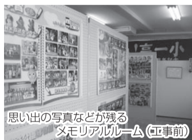
思い出の写真などが残るメモリアルルーム（工事前）

19年7月、「旧高根台第一小学校施設の利用に関する懇話会」が発足しました。跡地や施設の利用について地域の皆さんと協議を重ねた結果、学校としての建物を有効に使えるという視点から、特別支援学校小学部の移転を中心とした複合施設化を市に提案。これまで行っていた学校開放の継続や、旧高根台第一小学校の思い出を残した「メモリアルルーム」を残すことなども話し合われました。複合施設としての再オープンに、これらの提案が活かされています。