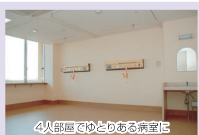
4人部屋でゆとりある病室に

この改修の終了後に、E館の4階を緩和ケア病棟(がん患者の身体的・精神的苦痛や不安を軽減する医療を行う病棟)として整備します。 22年1月に、東葛南部保健医療圏(船橋市川、浦安、鎌ヶ谷、習志野八千代)では初の緩和ケア病棟が、病床数20床でオープンします。