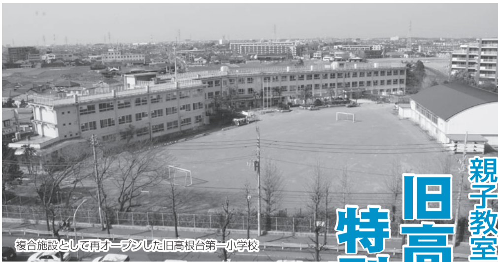
複合施設として再オープンした旧高根台第一小学校