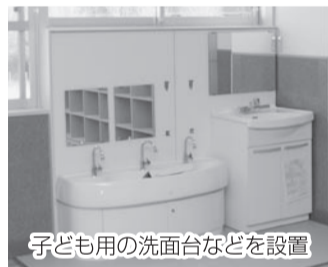
子ども用の洗面台などを設置

同校では児童・生徒数が急増し、教室数が不足してきていました。移転によって、教育環境にゆとりが生まれます。地域に開かれた学校として活用できるよう、学校を支援するボランティアなどの皆さんが活動したり、青少年相談に利用したりする場も設ける予定です。