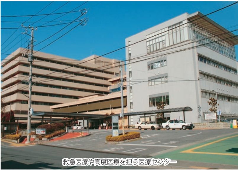
救急医療や高度医療を担う医療センター