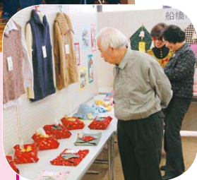
▲障害者の皆さんが制作した、衣服や絵画など約800点を展示した作品展も開催

イベントが、12月6日、7日に中央公民館で行われました。7日には、知的障害者更生施設・大久保学園の「サクシード」による演奏や植草学園短期大学の「D-link」によるダンスが披露されました。出演者の軽快な演奏や演技に、訪れた皆さんは手拍子で応え、会場全体が盛り上がりました。