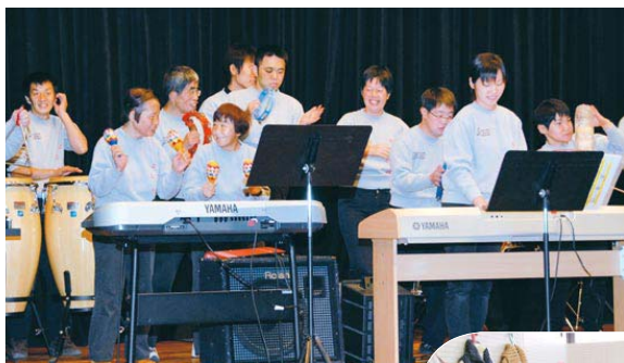
「アメリカパトロール」など全6曲を演奏