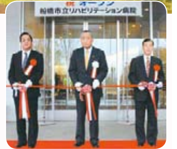
▲リハビリ医療の中核を担う、リハビリテーション病院が4月21日にオープン