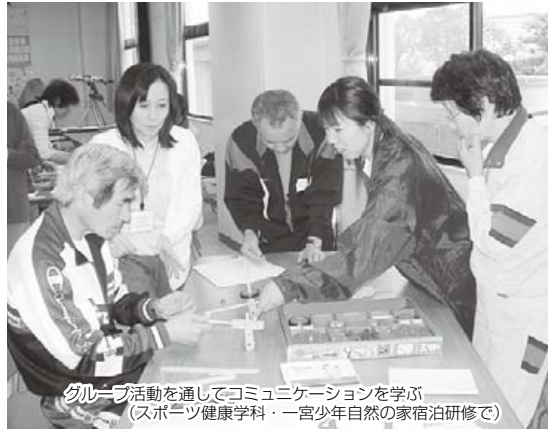
グループ活動を通してコミュニケーションを学ぶ(スポーツ健康学科・一宮少年自然の家宿泊研修で)

〔日時・内容等〕下表 〔対象〕市内在住で下表の年齢の人 ※次の人は受講できません ・まわりの学部各学科の同学科の受講・修了生。スポーツ健康学科は旧スポーツ健康大学、ボランティア学科は旧ボランティア大学、学びのコーディネーター 〔対象〕市内在住で下表の年齢の人 ※次の人は受講できません ・まわりの学部各学科の同学科の受講・修了生。スポーツ健康学科は旧スポーツ健康大学、ボランティア学科は旧ボランティア大学、学びのコーディネーター 〔期間〕4月～22年3月(1年間) 〔授業料〕無料(実習・教