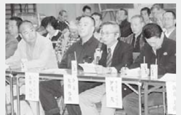
問 市民の声を聞く課 ☎436-2784