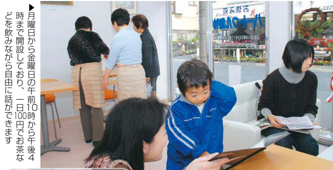
▶月曜日から金曜日の午前10時から午後4時まで開設しており、一日100円でお茶などを飲みながら自由に話ができます