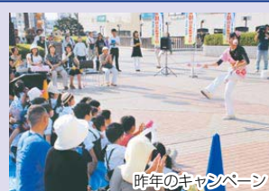
昨年のキャンペーン

夕暮れのひとつき、市内のイベントや市からのお知らせなど、最新情報をお伝えしています。