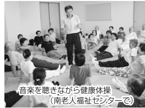
音楽を聴きながら健康体操(南老人福祉センター)

趣味や健康づくり 市内に3館ある老人福祉センター(下表)では、健康相談、機能回復訓練や軽体操、健康講演会などを開催しています。 また、カラオケや社交ダンスなど、様々なサークル 活動を通して交流も行われています。 〔開館時間〕 午前9時30分〜午後4時 〔休館日〕 毎週日、祝日、年末年始(12月29日~1月3日) 〔対象〕 60歳以上の入会者 〔利用料〕 無料(市外の人には200円)