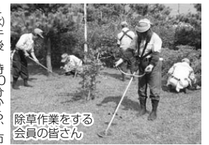
除草作業をする会員の皆さん