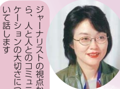
ジャーナリストの視点から、人と人のコミュニケーションの大切さについて話します

〈日程・テーマ・講師〉 ○10月22日水⇒発見!ご近所の底力、見直そう地域力 堀尾正明氏(フリーアナウンサー) ○10月29日水⇒「日本人の心」江戸時代から学ぶ 山本博文氏(東京大学史料編纂所教授)