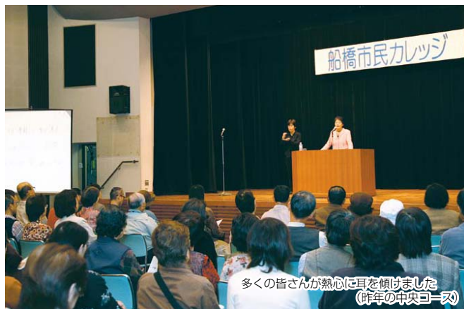
多くの皆さんが熱心に耳を傾けました (昨年の中央コース)

市民カレッジは、現代が抱える課題などにスポットをあてた、市民ボランティアが中心となって企画・運営する無料の講座です。今年、「地域の教育力」をテーマにした2コースを開講します。9月24日の公開講座のみの参加もできます。皆さんで参加して、楽しく学んでみませんか。