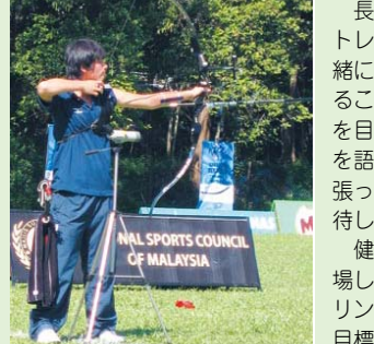
▲2006年に行われたマレーシアの大会で

中学卒業まで市内のアーチェリー施設で指導を受け、県立津田沼高校時代は毎日500～1000本の矢を放つなど、練習時間が12時間を越える日も…。太ももからの義足は姿勢を保つのがとても難しく、足に負担がかかるため、練習後には義足に血がにじむこともあったとのこと。現在も1日4時間、400本の練習は欠かしません。