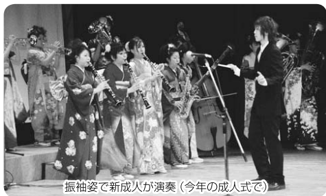
振袖姿で新成人が演奏(今年の成人式で)