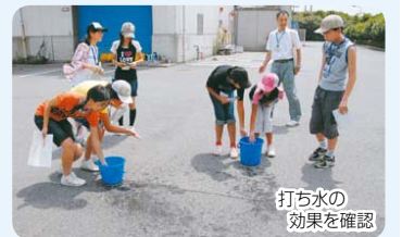
打ち水の効果を確認