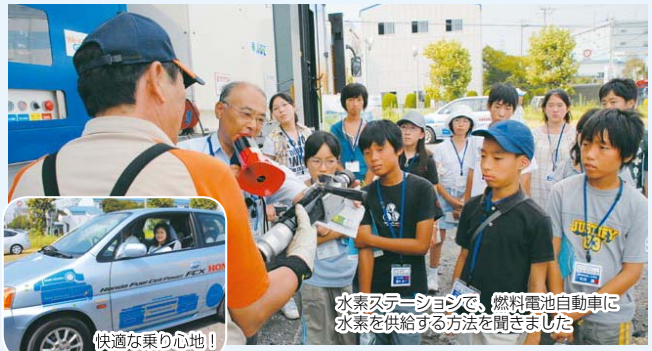
水素ステーションで、燃料電池自動車に水素を供給する方法を聞きました

8月19日、小学6年生と中学2年生の子ども記者67人が、南部清掃工場を見学。また、「ストップ!地球温暖化~身近な対策と最新の技術を学ぼう~」をテーマとする体験学習に参加しました。