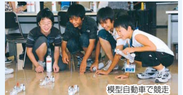
模型自動車で競走