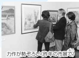
力作が勢ぞろい(昨年の市展で)

〈時間〉各午前10時～午後6時30分※前期・後期とも最終日は午後5時まで。毎週休日は