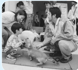
▲犬にさわるときは飼い主に聞いてから(昨年のフェスティバルで)