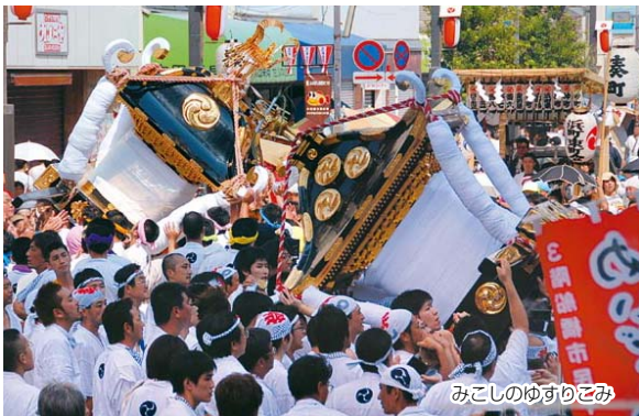
みこしのゆすりごみ