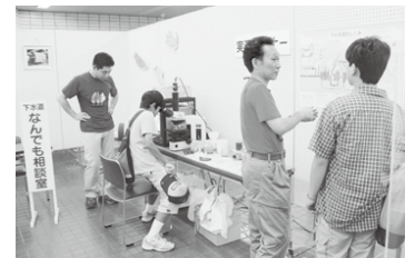
見える仕組みを、下水の浄化実験装置や微生物の顕微鏡映像で紹介いたします。※午前9時～正午、午後1時～4時45分

▼展示コーナー 下水道の役割や計画、整備状況などを模型やパネルで紹介。小学生が描いた下水道の絵画や書道作品も展示します。 ▼下水道なんでも相談 下水道の計画や建設、受益者負担金、トイレ改造費の貸し付けなど、なんでも相談ください。 ▼実演コーナー 汚水がきれいな水ごよみ