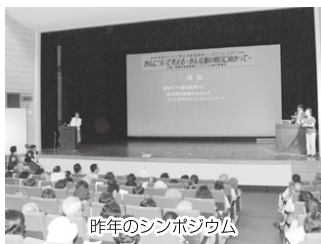
昨年のシンポジウム

〈日時〉9月6日(土) 午後1時～3時30分 〈会場〉勤労市民センター ※入場無料 〈定員〉当日先着350人 ※手話通訳・要約筆記あり。1歳～未就学児は保育あり(8月29日(金)までに要予約)