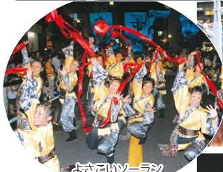
よさこいソーラン