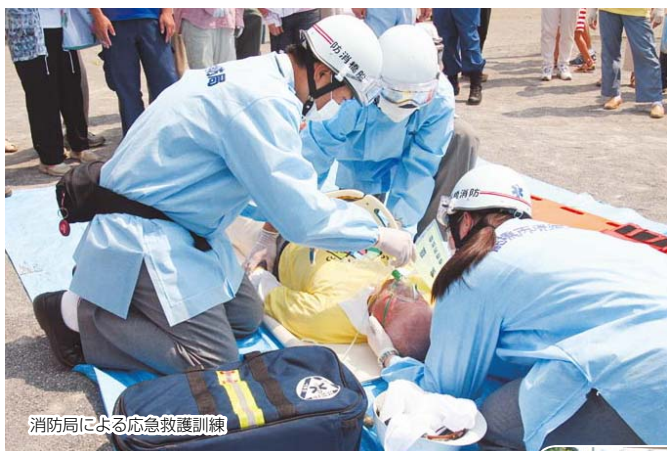
消防局による応急救護訓練

大規模災害時には、行政機関などの公的支援が機能するまで、かなりの時間を要します。そうした状況下では、自分の身は自分で守り、隣近所の助け合いによって、自分たちのまわりを守っていかなくてはなりません。 普段からの、家庭での備えや隣近所との交流が、災害時には大きな力となり、減災へとつながります。