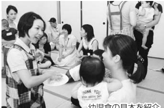
幼児食の見本を紹介

□日程・会場 9月12日(金)⇒北部保健センター (☎449-7600)、19日(金)⇒中央保健センター (☎423-2111)、25日(木)⇒東部保健センター (☎466-1383) 時間各午後2時～3時 内容初めての歯みがき、離乳食完了に向けて 対象19年10～11月生まれの第1子と保護者 定員各先着30組 費用無料 申込み希望する各保健センターへ