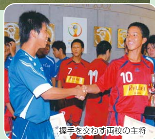
握手を交わす両校の主将

7月28日から、埼玉県で開催されている全国高校総合体育大会で、市立船橋高校サッカー部が2年連続、大会最多となる6度目の優勝を果たしました。8月4日に行われる予定だった流通経済大学付属柏高校との決勝戦は、激しい雷雨のため中止。両校優勝となりました。