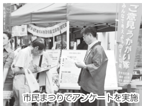
市民まつりでアンケートを実施

市では、市川・松戸・鎌ヶ谷の3市とともに、19年4月「東葛飾・葛南地域4市政令指定都市研究会」を設け、合併や政令指定都市への移行も、将来の選択肢のひとつと考え、20年度末まで共同で研究しています。今年3月末には、この地域の現状や課題、合併や政令指定都市に移行政令指定都市の効果や影響などを分析した中間報告がまとまりました。