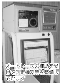
オートレーサーの補助を受けて測定機器等を整備しています

光化学スモッグの原因となる光化学オキシダントの昼間の年平均値は、昨年の数値とほぼ同じですが、すべての測定局で環境基準値を超えました。