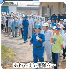
あわてずに避難を

8月31日(日)、全市民立小学校と旧高根台第一小学校で、無線非常通信連絡会とともに、情報収集・伝達などへの対応や、市アマチュア無線非常通信連絡会とともに、情報収集・伝達などの訓練に取り組みます。