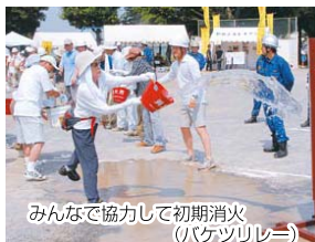
みんなで協力して初期消火(バケツリレー)

また、避難所に設けられる医療救護所に、医師らが参集。一部の避難所では、トリアージ(負傷者のけがの程度によって治療順位を選別・決定)などの避難所運営訓練を実施するほか、新たに簡易型組立式トイレの組み立て訓練を行う会場もあります。