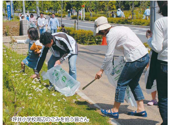
坪井小学校周辺のごみを拾う皆さん

味が自慢の船橋の野菜 6月7日、JR船橋駅北口おまつり広場で野菜の即売会が行われました。この催しは、船橋の都市農業を知ってもらおうと行われ、今年で6回目になります。船橋産のニンジン、小松菜、枝豆などを格安で販売。あつという間に売り切れてしまいました。また、昨年引き続き「第2回船橋にんじんフェア」もイトーヨーカ堂船橋店前で開催され、品評会のほか、ニンジンの試食やニンジンジュースの試飲もあり、「こんなに甘いのね」と驚きの声が上がっていました。