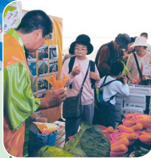
▲船橋にんじんフェアで

味が自慢の船橋の野菜 6月7日、JR船橋駅北口おまつり広場で野菜の即売会が行われました。この催しは、船橋の都市農業を知ってもらおうと行われ、今年で6回目になります。船橋産のニンジン、小松菜、枝豆などを格安で販売。あつという間に売り切れてしまいました。また、昨年引き続き「第2回船橋にんじんフェア」もイトーヨーカ堂船橋店前で開催され、品評会のほか、ニンジンの試食やニンジンジュースの試飲もあり、「こんなに甘いのね」と驚きの声が上がっていました。