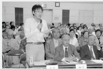
☎ 市民の声を聞く課 ☎436-2784