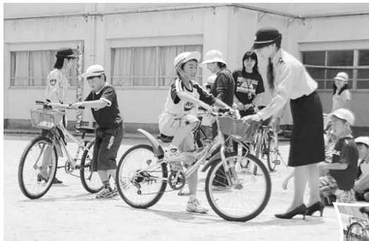
「自転車も 乗れば車の仲間入り」 二宮小学校での交通安全教室 (6月6日)