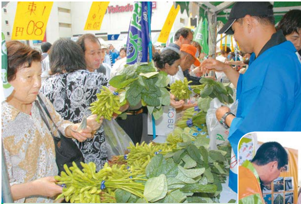
◀即売会には新鮮な船橋産野菜が