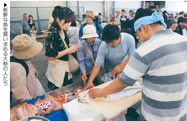
▶新鮮な魚を買い求める大勢の人たち