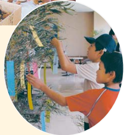
▲短冊に願いを込めて

6月7日、環境フェアが中央公民館で行われました。環境保護やリサイクルなどの活動に取り組む、42の団体が出展。様々な展示や体験コーナーが設けられ、たくさんの子どもたちが、木の美細工や竹とんぼ作りなどを楽しんでいました。また、会場には七夕の笹も。「冷蔵庫を開けっ放しにしません」など、身近にできるエコ活動を書いた色とりどりの短冊が飾られていました。