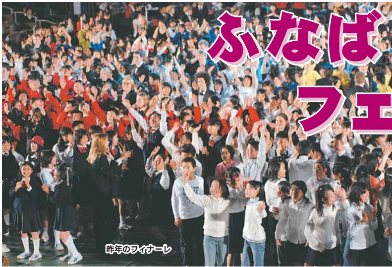
昨年のファイナーレ