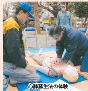
心肺蘇生法の体験

防災とボランティア週間(1月15日(火)～21日(月))にあわせて、防災イベントを行います。 <日時> 1月19日(土)午前10時～午後1時 <会場> 中央公民館 駐車場はありません <内容> ▶講演会「大地震に備えて自助・互助・共助の必要性を考えよう」 午前10時30分～正午 / 講師福田孝至氏(市川災害ボランティアネットワーク代表) / 当日先着270人