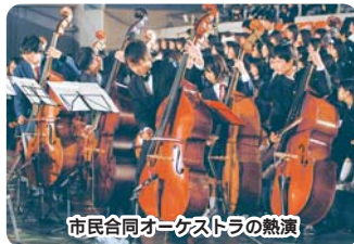
市民合同オーケストラの熱演

☐ケーブルテレビ9チャンネルで生中継。 詳しくは、JCN船橋習志野☎425-0100へ。