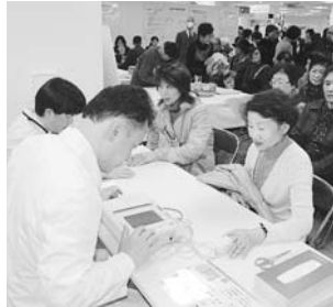
血管推定年齢測定(昨年のフェアで)

〈日時〉1月17日(木)~22日(火) 午前10時~午後7時30分 22日は午後7時まで 〈会場〉東武百貨店船橋店6階 イベントプラザ 入場無料