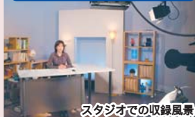
スタジオでの収録風景

ふなばしCITY NEWS 毎週土更新 毎日午後0時30分～、6時30分～ 1/12(土)～新春のアンデルセン公園 1/19(土)～成人式 ほか 1/26(土)～防災フェアふなばし ほか