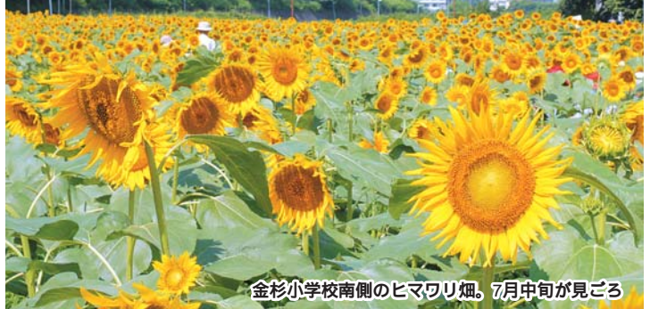
金杉小学校南側のヒマワリ畑。7月中旬が見ごろ