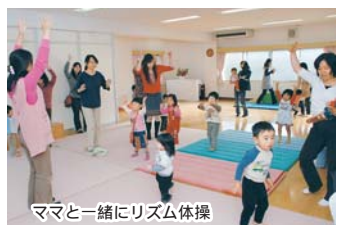
ママと一緒にリズム体操

南本町☎434-3910 相談☎435-8333 高根台☎466-5666 相談☎466-3633