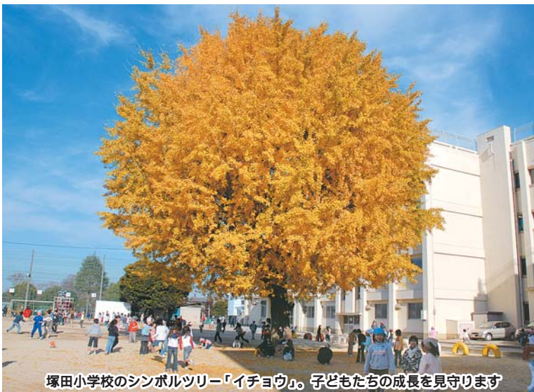
塚田小学校のシンボルツリー「イチョウ」。子どもたちの成長を見守ります