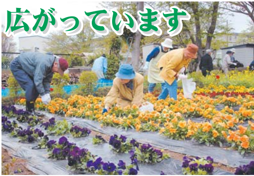
しんわ会花壇愛好クラブ(大北63)

市では、まちかどに草花を植栽し、明るくおおいのあるまちづくりを進める町会・自治会に「花いっぱいいまちづくりの助成」を行っています。 ⑩(財)緑の基金 ☎436・2557