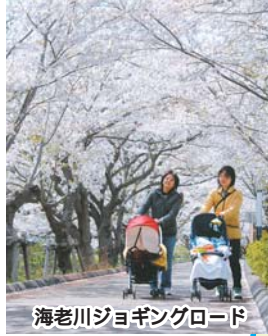
海老川ジョギングロード