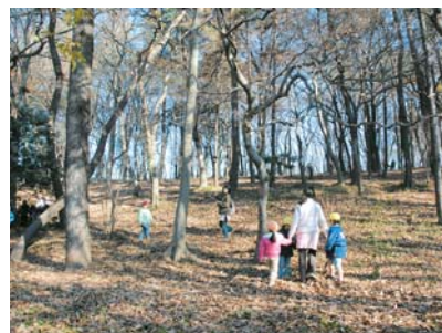
保育園の子どもたちも散歩に訪れます(松が丘市民の森)

約10万本のコスモスが、可憐な花を咲かせる佐久間牧場(三咲町)。このコスモス畑は、緑化フェアにあわせて植えられたものです。今年も9月中旬から見ごろを迎え、期間中には、農産物の直売や搾乳体験などが楽しめるイベントを予定しています