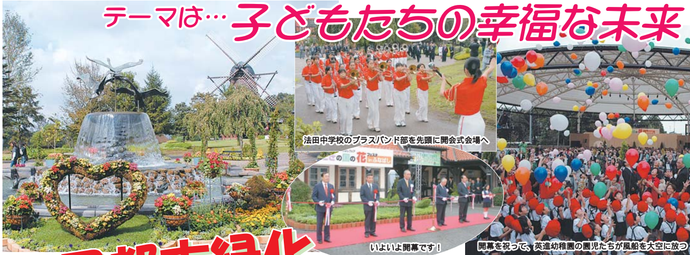
法田中学校のブラスバンド部を先頭に開会式会場へ