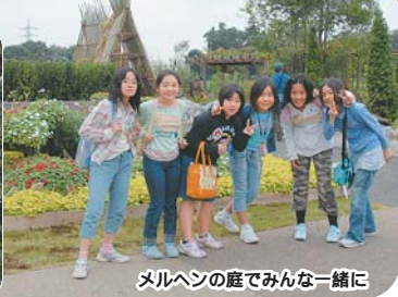
メルヘンの庭でみんな一緒に