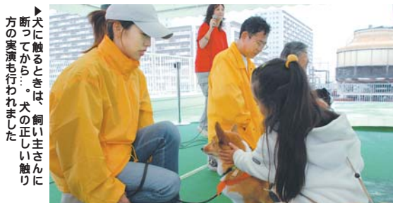
犬に触るときは、飼い主に断ってから...犬の正しい触り方の実演も行われました