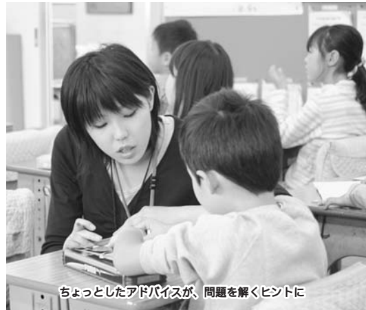
ちょっとしたアドバイスが、問題を解くヒントに

☐納付が困難な場合は、早めに介護保険課までご相談ください(船橋駅前総合窓口センター、各出張所では受け付けできません)。