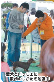
愛犬といっしょに散歩のしかたを勉強中