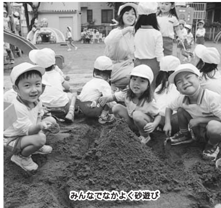
みんなでなかよく砂遊び

原付は50cc以下(水・黄・桃色ナンバー除く) 東船橋駅第(B)→同駅第1駐輪場交番北側隣 東船橋駅第(B)→同駅第7駐輪場北側の飛地部分