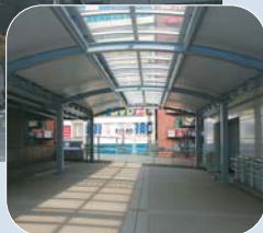
▶左側が京成船橋駅、右側がフェイスビル

フェイスビル2階の自由通路と京成船橋駅2階コンコースとを結ぶデッキが、11月17日(土)から利用できるようになります。これにより、JR船橋駅と京成船橋駅の乗り換えが、よりスムーズになります。