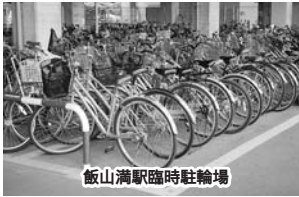
飯山満駅臨時駐輪場