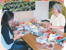
木の实を使って飾り物づくり

アンデルセン公園の隣にある農業センターで、10月2日「花と野菜のフェスティバル」が開幕しました。色とりどりの花々が施設内に植えられ、来場者は思わずウットリ...。船橋の農業を紹介するパネル展示や、工作教室も行われていました。また、11月4日までの土・日曜日には、採りたての野菜や花などの即売や、太鼓の演奏、樹木講座などが行われます。アンデルセン公園にお越しの際は、お立ち寄りください。