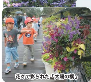
花々に彩られた「太陽の橋」