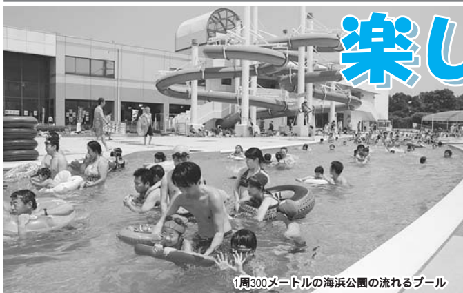
1周300メートルの海浜公園の流れるプール