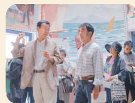
児童館の壁画でアンデルセンの生涯を学ぶガイドボランティア

この日は、すでにアンデルセン公園で活躍しているガイドボランティアの皆さんと、新たに応募した皆さんとの初顔合わせ。園長をはじめスタッフとともに園内をめぐり、ガイドの実演などを行いました。