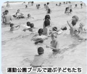
運動公園プールで遊ぶ子どもたち

〈交通〉JR船橋駅北口から市立体育館経由または二和道経由「鎌ヶ谷大仏」行きバスなどで「市立体育館」下車