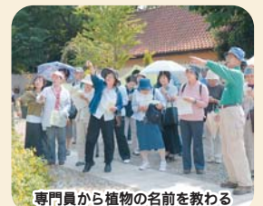
専門員から植物の名前を教わる

フェア期間中、40人の市民ボランティアが園内のガイドを行います。6月7日、研修会が開かれました。