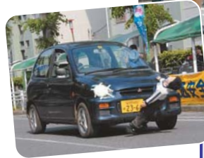
ダミー人形を使った衝突実験。事故の恐ろしさを改めて痛感しました

交通事故ゼロ を目指して、5月12日に北習志野駅前商店街で「交通安全フェスティバル」が開催されました。会場では、市民一人ひとりに交通安全の知識を高めてもらおうと、街頭啓発や交通安全クイズなどが行われました。家族連れに人気の、パトカーや白バイ、はしご車の体験乗車には長蛇の列が…。また、1日警察署長となった習志野台第一小学校の児童たちは、「交通ルールを守ります」と元気で宣言しました。