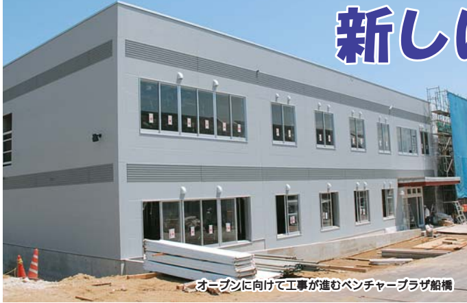
オープンに向けて工事が進むベンチャープラザ船橋

8月、公的インキュベーション施設「ベンチャープラザ船橋」がオープンします。独立行政法人中小企業基盤整備機構が建設を進めてきたもので、市では、地域産業の振興を図るため、用地を確保するとともに、入居する企業等の賃料の一部を助成します。