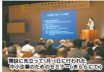
開設に先立って5月18日に行われた中小企業のためのセミナー(さくらにて)

企業が成長するには、企業同士は当然ですが、その中の人や技術との出会いが必要です。ベンチャープラザ船橋には、30程度の入居者が見込まれ、創業期など同じ立場での情報交換などは、有意義なものとなるはずですが、そのような出会いの場を設けるのも私たちの仕事。入居者が今持っている技術を、確実に事業化できるようサポートし、この施設が、新製品・新事業の発祥の地となることを目指していきたいですね。