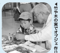
竹や木の葉でオブジェ作り