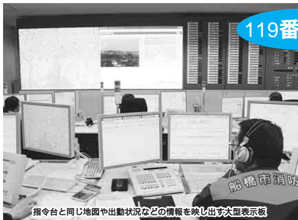
指令台と同じ地図や出動状況などの情報を映し出す大型表示板