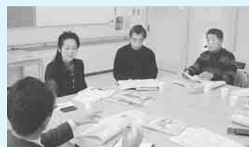
18年度は三鷹市への視察も行いました