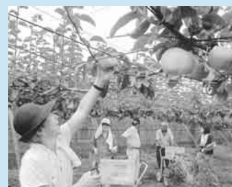
梨の収穫を手伝う受講生