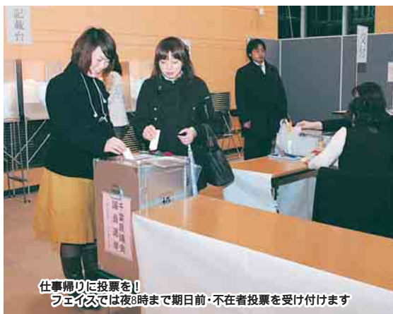
仕事帰りに投票を！ フェイスでは夜8時まで期日前・不在者投票を受け付けます