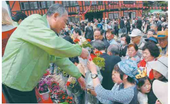
藤代市長からセラニウム300鉢が配られました