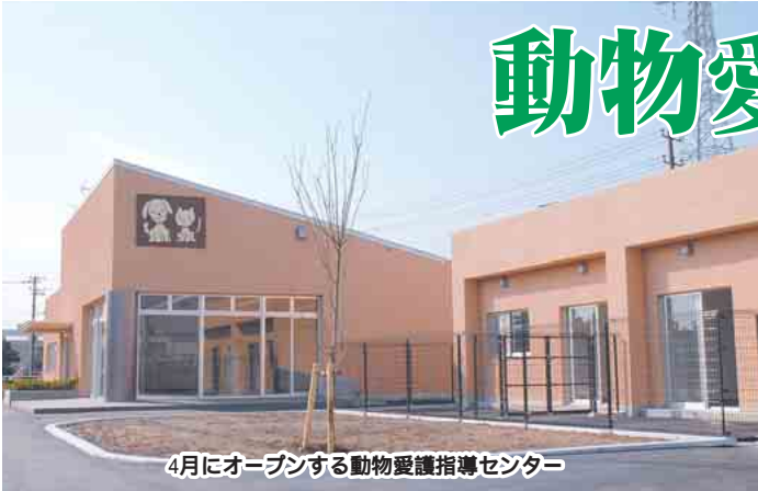
4月にオープンする動物愛護指導センター