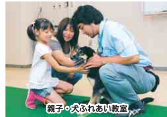
親子・犬ふれあい教室

センターでは、収容される動物がゼロになることを目指し、動物の正しい知識やしつけ方などの普及・啓発に取り組んでいきます。