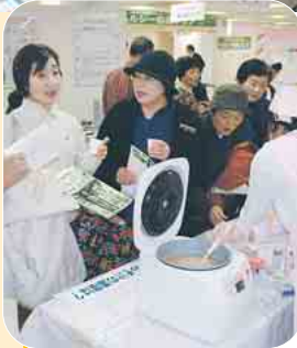
体に良い塩分のみそ汁を試飲

健康チェック 第20回ヘルシー船橋フェアが、東武百貨店船橋店で、1月18日から23日まで開催されました。今回のテーマは「自分で守ろう自分の健康」。会場では、医療相談や食育のコーナーが設けられたほか、スポーツ吹矢体験、ヨガ教室などの様々なイベントが行われました。なかでも、血管年齢・肺活量測定コーナーは大人気。測定結果に対するアドバイスに耳を傾ける多くの皆さんの姿が見られました。