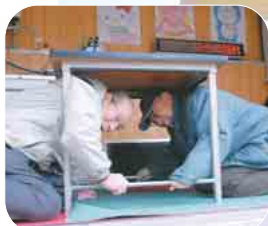
三咲小学校に設けられた地震車体験コーナー