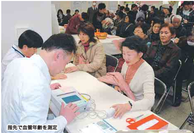
指先で血管年齢を測定

健康チェック 第20回ヘルシー船橋フェアが、東武百貨店船橋店で、1月18日から23日まで開催されました。今回のテーマは「自分で守ろう自分の健康」。会場では、医療相談や食育のコーナーが設けられたほか、スポーツ吹矢体験、ヨガ教室などの様々なイベントが行われました。なかでも、血管年齢・肺活量測定コーナーは大人気。測定結果に対するアドバイスに耳を傾ける多くの皆さんの姿が見られました。