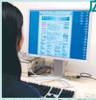
市のホームページは、1か月に約10万件のアクセスがあります

☑掲載基準、申込方法など、詳しくは市ホームページ( http://www.city.funabashi.chiba.jp/ )をご覧ください。