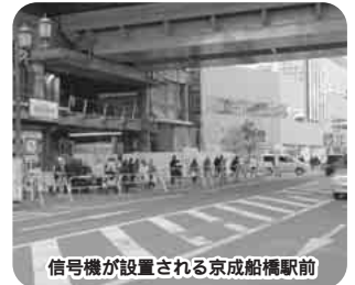
信号機が設置される京成船橋駅前

京成本線は昨年11月末から、上下線とも高架による運行を開始しましたが、駅前通りを横断する歩行者が多く、大変危険な状況となっています。県と市では、歩行者の安全確保と、京成船橋駅利用者の利便性の向上を図るため、3月1日(予定)から下記のとおり通行形態を一部変更します。