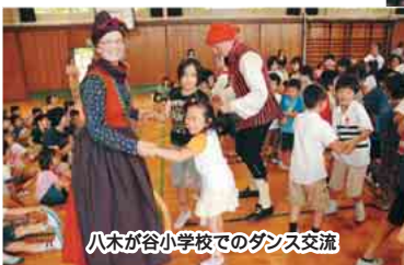
八木が谷小学校でのダンス交流

▶昭和61年にアメリカ・ハイワード市と姉妹都市を結び、今年で20周年を迎えました。これを記念して、9月に訪れた市民代表団と音楽などを通じ、交流を深めました 7月には、デンマーク・オーデンセ市からフォークダンスグループが来日