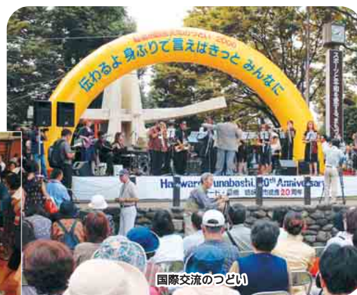
国際交流のつどい