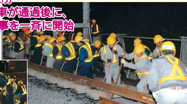
人力で高架線路側へ線路を移動

11月25日 午前0時45分~ 下り線の最終電車が通過後に、 切り替え工事を一斉に開始