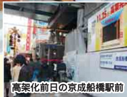
高架化前日の京成船橋駅前