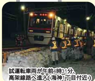
試運転車両が午前4時31分、 高架線路へ進入(海神1丁目付近)