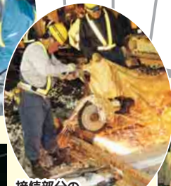
接続部分の 余分な線路を切断

11月25日 午前0時45分~ 下り線の最終電車が通過後に、 切り替え工事を一斉に開始