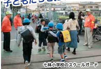
七礼小学校のスクールガード

◀1月、児童・生徒防犯対策室を設置。6月から、スクールガードの登録を開始しました(11月30日現在の登録は、245団体・3600人)