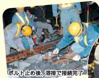
ボルト止め後、溶接で接続完了