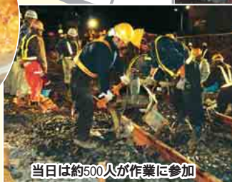
当日は約500人が作業に参加