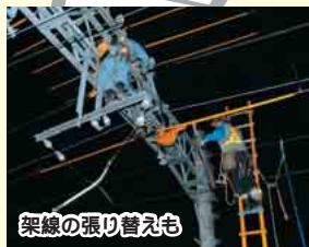
架線の張り替えも