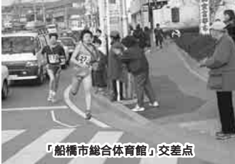
「船橋市総合体育館」交差点

1月14日(日)に、成人の日記念市民駅伝競走大会を開催します。このため、コースとなる市内の道路では、午前9時～10時の間に交通が一部規制されます。皆様のご協力をお願いします。