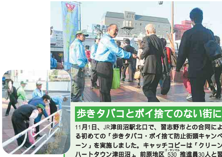
津田沼駅周辺での清掃活動