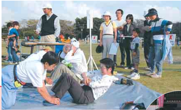
↑陸上競技場では、腹筋などの体力測定を実施。反復横跳び