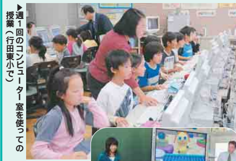
▶週1回のコンピュータ室をの授業(行田東小で) プラズマビジョンも活用しています

市では、情報社会の中で必要な情報を自分で選り取り活用し、発信できる能力を育てるため、平成8年度までに全小・中学校にパソコンを配置。12年度には、総合教育センターを中心に学校間のネットワークを整備し、インターネットを活用した授業を行っています。今回、10小学校のパソコンを最新機種に更新。コンピュータ室(42台)、各教室(1台)、特別教室(6台)にパソコンを整備しました。さらに、今までのパソコンを各教室に導入していく予定です。 効果的な授業のため 教師への研修を実施 各学校では、教師が新しいパソコンを使い、授業を円滑に進められるよう研修を実施するほか、子どもたちがインターネットによる犯罪に巻き込まれないように、情報モラル教育も積極的に推進していきます。今後は22年度末までに、市内の全小・中学校に、新しいパソコンを順次導入していく予定です。