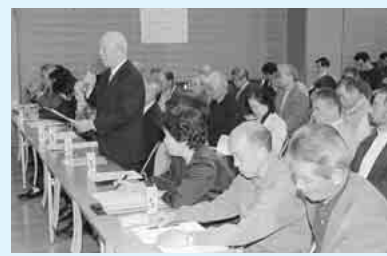
市民の声を聞く課 ☎436-2784