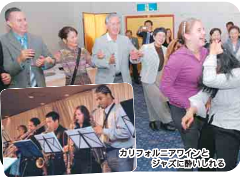
カリフォルニアワインとジャズに酔いしれる