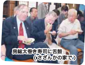
房総太巻き寿司に舌鼓(さざんかの家で)