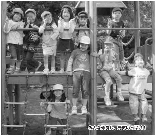
みんな仲よし。元気いっぱい!