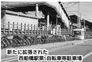
新たに拡張された 西船橋駅第5自転車等駐輪場