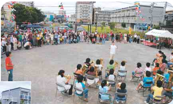
八栄小学校器楽部の演奏で幕を開けた開園記念セレモニー

あおぞら公園オープン! 市場通り北側に、「夏見1丁目あおぞら中央公園」がオープンしました。広さ約1700平方メートルの公園には、砂場や遊具のほか、オシマザクラやクチナシなどを植えた芝生広場も整備。9月23日には地元自治会による「あおぞらまつり」が開催され、多くの子どもたちが、×ゲームやお菓子食い競走などに参加していました。