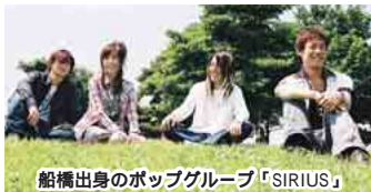
船橋出身のポップグループ「SIRIUS」

11月18日(土)午後1時30分～/中央公民館前広場 雨天時は講堂/市民等から募集したグループの演奏/ゲスト「SIRIUS」/当日自由参加