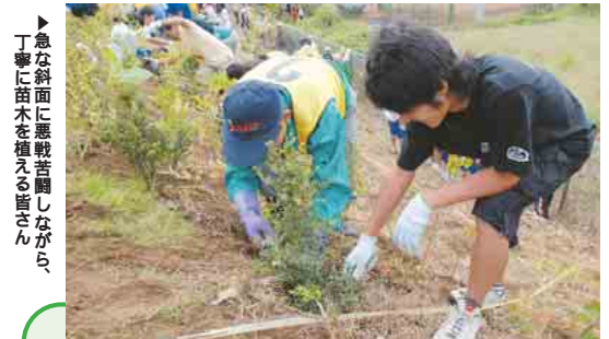
急な斜面に悪戦苦闘しながら、丁寧に苗木を植える皆さん

自分たちの手で森を (助緑の基金・設立20周年を記念して、9月23日に、「ふるさとの森づくりをしよう」と題した植樹会が行われました。当日は、船橋西高校の生徒や地域の皆さんなど約200人が参加。ヤツデやサザンカ、スタジイなどの苗木およそ1500本を、グラウンド脇の斜面に植えていきました。苗木は、10年ほどで立派な森に姿を変えるそうで、作業を終えた皆さんは、充実した表情で斜面を眺めていました。 この植樹会は、(財)イオン環境財団の助成を受けて行われました。