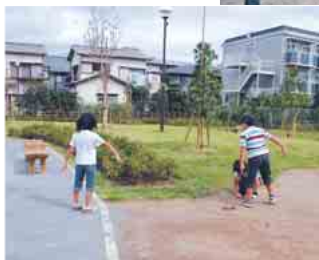
芝生広場にはベンチや散策路も

あおぞら公園オープン! 市場通り北側に、「夏見1丁目あおぞら中央公園」がオープンしました。広さ約1700平方メートルの公園には、砂場や遊具のほか、オシマザクラやクチナシなどを植えた芝生広場も整備。9月23日には地元自治会による「あおぞらまつり」が開催され、多くの子どもたちが、×ゲームやお菓子食い競走などに参加していました。