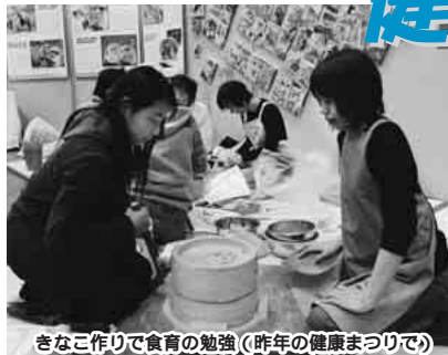
きなこ作りで食育の勉強(昨年の健康まつりで)