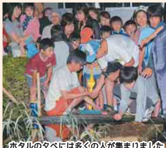
ホテルのタベには多くの人が集まりました

放したホテルは12匹。大きさは5ミリくらいですが、力強く光っていました。くらやみの中で光るホテルを見て、周りの人