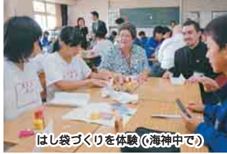
はし袋づくりを体験(海神中で)