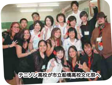
テニソン高校が市立船橋高校文化祭へ