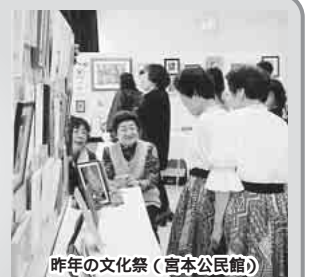
昨年の文化祭(宮本公民館)

公民館や老人福祉セ ンターでは、左・下表 の日程で文化祭を開催 します。サークル・ク ラブ活動の発表や展示 のほか、バザー、模擬 店なども行います。