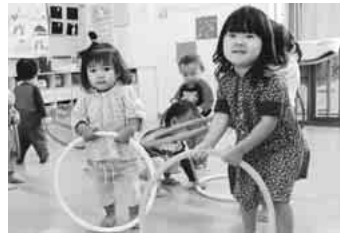
「アソビで遊ぶ」(まご保育園)