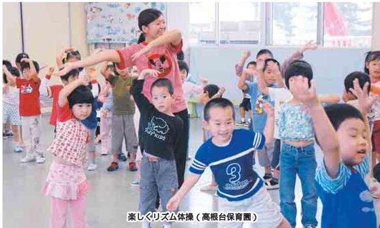
楽しくリズム体操(高根台保育園)