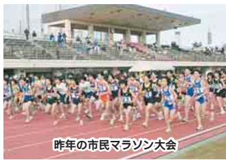
昨年の市民マラソン大会

日程11月18日(土) 会場運動公園 種目・対象 男子5キロ、女子3キロ、男子(中学生1年)3キロ⇒中学生以上の健康な人 中学生は市内在住・在学 親子2キロ⇒小学生以下の子と保護者 費用500円(中学生300円) 申込み10月18日(水)(必着)までに、申込書に必要事項を記入し、費用、返信用ハガキを添えて、生涯スポーツ課(〒273-8501 住所不要☎436-2914)へ 用紙は同課、体育施設管理事務所、船橋アリーナ、武道センター、各公民館・出張所で配付