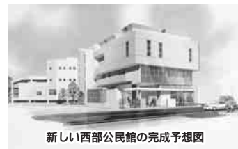
新しい西部公民館の完成予想図

児童ホーム 老人憩の家を併設 西部公民館は、昭和40年に完成した、市内25館のうちでも古い公民館です。今月、現在の施設の解体工事を始め、19年1月に新施設の建設を開始。新しい西部公民館は、20年4月に児童ホーム・老人憩の家との複合施設としてオープンする予定です。 新しい公民館は、地下1階、地上3階の鉄筋コンクリート造り。4つの集客室と音楽室、実習室、和室図書室のほか、軽スポーツや武道などができる体育施設やエアーシヨウ室と講堂を設けます。 また、高齢者や身体の不自由な皆さんにも利用しやすいよう、エレベーターを