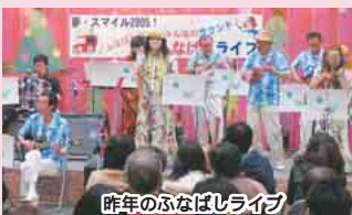
昨年のふなばしライブ

開催日時11月18日(土)午後1時30分～ 会 場中央公民館前広場 対象ジャズ、クラ シック、ポップスなどの音楽活動グル ープ 定員5組程度(多数は選考) 申込み 9月30日(土)までに、中央公民館 ☎434-5551 へ