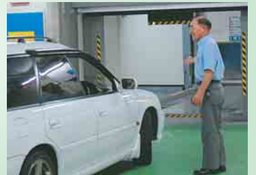
フェイス地下駐車場の管理をする会員