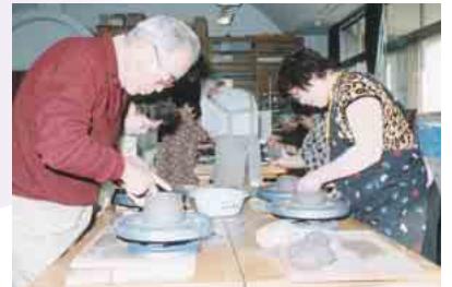
陶芸学科で世界で一つだけの器づくり