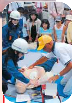
女性消防団からAEDの使い方を学ぶ参加者

8月27日、9時20分のサイレンとともに市民参加型の総合防災訓練がスタート。市立小学校など57か所の会場に、市民約1万人が避難しました。中央会場の葛飾小学校では、自治会・町会員などが避難訓練に引き続き、消火器を使った初期消火、災害救助犬による人命救助、AED(自動体外式除細動器)を使った応急救護など実践的な訓練を行いました。