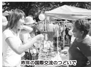
昨年の国際交流のついで

日時9月30日(土)午前10時～午後3時 雨天は10月1日(日) 会場天沼弁天池公園 内容 各国の伝統芸能・フリーマーケット・遊び、ハイワードの高校生による音楽演奏、スタンブラリー、ストーリーテリング ほか 問合せ市国際交流協会☎436-2083