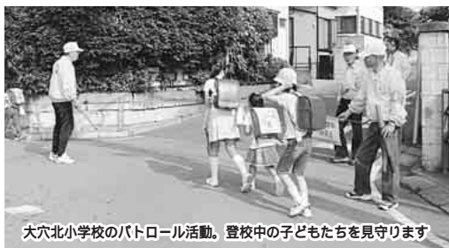
大北北小学校のパトロール活動。登校中の子どもたちを見守ります

子どもたちを犯罪から守るためには、さらに多くの皆さんの参加が必要です。引き続き募集をしていますので、登録をお願いします。