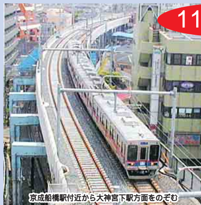
京成船橋駅付近から大神宮下駅方面をのぞむ

長年の懸案だった京成本線の連続立体交差事業。一昨年の上り線に続き、いよいよ、11月25日(土)の始発から下り線(成田方面)も高架化されます。