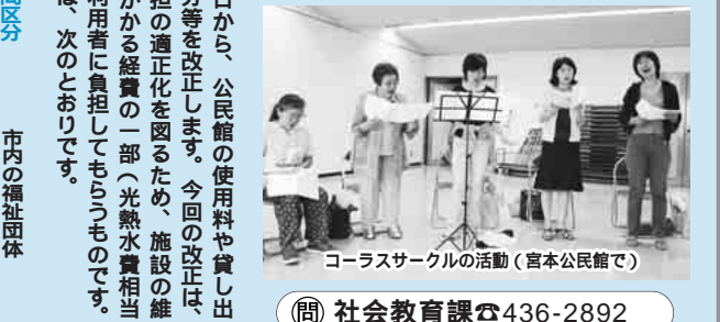
コーラスサークルの活動(宮本公民館で)

市内の福祉団体 市の後援による事業 免除の団体が入場料を徴収する場合 〔減額対象〕の使用者が入場料を徴収する場合は、減額の対象とはなりません。使用料の表記は、総額表示方式に変更 10月1日から、公民館の使用料や貸し出し時間区分等を改正します。今回の改正は、受益者負担の適正化を図るため、施設の維持管理にかかる経費の一部(光熱水費相当分)を、利用者に負担してもらうものです。改正点は、次のとおりです。 問合せ)社会教育課☎436-2892