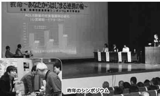
昨年のシンポジウム

9/9(土) 市民とともに考える救急医療シンポジウム2006 家族で知ろう 転ばぬ先の予防医学 ~ 高齢者救急 ~