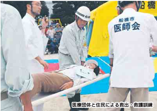
医療団体と住民による救出・救護訓練

8月27日(日)午前9時20分から 総合防災訓練を実施 全市立小学校55校と船橋中学校、大穴中学校に避難所を開設します。 午前9時20分に、防災行政無線でサイレンを鳴らします。それを合図に、最寄りの小学校などに避難してください。