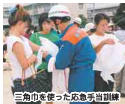
三角巾を使った応急手当訓練

地震などの災害発生時には、市民への情報伝達、物資の供給、ライフラインなどの応急的な復旧を迅速に行うことが重要です。また、近隣市の公共施設を、避難場所として利用できるように、新たな実施します。 また、避難所に設けられる、医療救護所に医師らが参集。一部の避難所では、救急医療用具の点検や、トリアージ(負傷者の程度によって治療順位を決定・決定)などの避難所運用訓練を、新たに実施します。