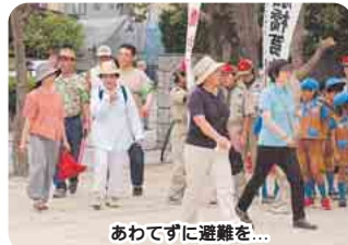
あわてずに避難を...