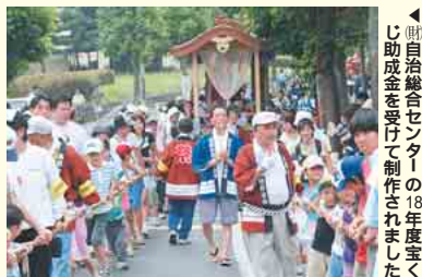
▲(自治総合センター)の18年度まで補助金を受けて制作されました

このお祭りがさらに40回...もっと長く続いて、地域の人々がより仲良くなり、多くの人が楽しめるといいなと思います。