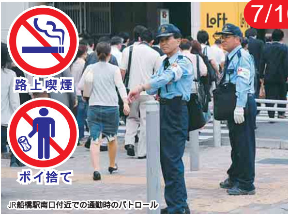
JR船橋駅南口付近での通勤時のパトロール