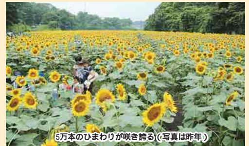
5万本のひまわりが咲き誇る(写真は昨年)

市農業士等協会やひまわりボランティア、金杉小学校の皆さんが育てた5万本のひまわりが、7月中旬に見ごろを迎えます。