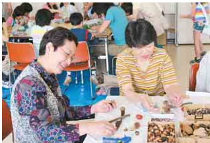
▲大人にも好評なオブジェ作り

環境を考えよう 6月10日、中央公民館で環境フェアが開かれました。環境団体や企業、行政など51団体が参加し、日ごろの活動をパネル展示などで発表。当日は約3800人が訪れ、リサイクルや環境の保護などへの理解を深めていました。また、子どもイベント広場では、ガラスのリサイクルクラフト、木の实を使ったオブジェ作り、ミニロボット作りなどの体験コーナーが設けられ、たくさんの親子が楽しみながら学習する姿が見られました。