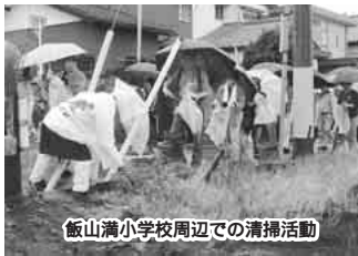
飯山満小学校周辺での清掃活動

5月28日の「クリーン船橋30の日」の清掃活動には、雨にもかかわらず、約2万6000人の皆さんが参加しました。55小学校に集められた、空きビン・カンやごみの総量は2万4950キログラムに上りました。ご協力ありがとうございました。