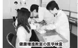
健康増進教室の医学検査