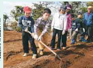
▶4月に高根台公民館で行われた農業体験

市では、毎月第3土曜日を「ハッピーサタデー」の日として、子どもたちが地域でスポーツや文化、ボランティア活動などに親しめるよう、公民館を中心に様々なイベントを行っています。皆さんも参加してみませんか。