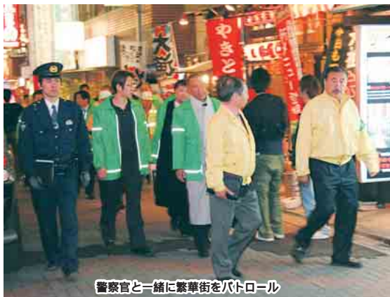
警察官と一緒に繁華街をパトロール

安全で安心なまちづくりは、地域を見守る目が増えることにより実現します。市では、事業所の協力を得て、新たに「ひやりハット」と防犯ネットワークをつくります。