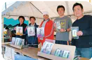
「船橋三番瀬」の海苔をPRする漁業協同組合・海苔研究会の皆さん(問合せ) 同組合☎431-2041

三番瀬のアサリ&海苔 都心近 い潮干狩り場として人気のスポット。ふなばし三番瀬海浜公園。ゴールデンウィーク中は天候にも恵まれ、市内外から約6万3000人が来場しました。園内は、粒ぞろいのアサリで一杯になった網やバケツを持つ皆さんで大にぎわい。また、船橋ブランドとして売り出し中の「船橋三番瀬」の海苔を、船橋市漁業協同組合の海苔研究会がPR。焼き海苔・味付け海苔など、船橋の美味しい海苔を販売していました。