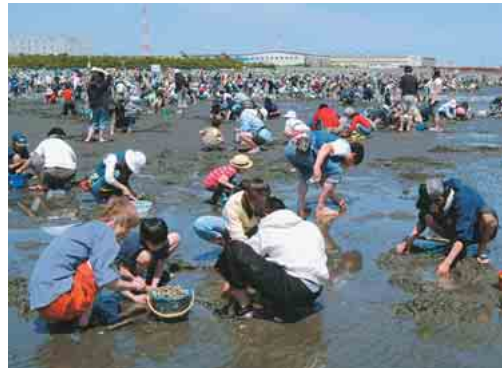
潮干狩りは、6月18日(日)まで開催しています

三番瀬のアサリ&海苔 都心近 い潮干狩り場として人気のスポット。ふなばし三番瀬海浜公園。ゴールデンウィーク中は天候にも恵まれ、市内外から約6万3000人が来場しました。園内は、粒ぞろいのアサリで一杯になった網やバケツを持つ皆さんで大にぎわい。また、船橋ブランドとして売り出し中の「船橋三番瀬」の海苔を、船橋市漁業協同組合の海苔研究会がPR。焼き海苔・味付け海苔など、船橋の美味しい海苔を販売していました。