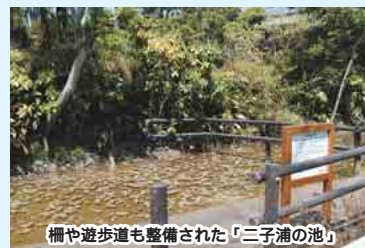
柵や遊歩道も整備された「二子浦の池」

17年度までに「二子浦の池」のほか、「二子藤の池」(東中山1)、「葛飾神社の池」(西船5)、「ゲエロの池」(印内1)、「倶利伽羅不動尊の池」(飯山満町3)、「葛藤の井」(西船6)の合わせて6か所の湧水池が、憩いの空間として生まれ変わっています。